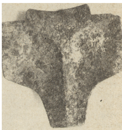
Ryc. 4. Naplecznik z Borówka, strona wewnętrzna.

w Siedlątkowie w woj. sieradzkim i w Plemiętach w woj. toruńskim 4 . W Siedlątkowie, gdzie stwierdzono płytowy napierśnik, nie udało się wyróżnić konkretnych pozostałości płytowego naplecznika, zdecydował o tym niewątpliwie bardzo zły stan zachowania całego znaleziska. W Plemiętach mamy do czynienia z kiryssem folgowym, o swoistej, odmiennej konstrukcji. Naplecznik z Borówka jest zatem unikatem w skali krajowej.