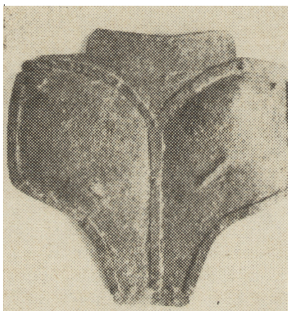
Ryc. 3. Naplecznik z Borówka, strona zewnętrzna.