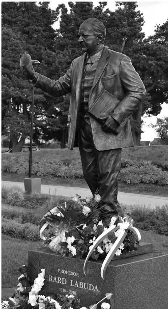
Pomnik w Luzinie

Tego samego dnia (10 listopada) w Wojewódzkiej Bibliotece Publicznej w Gdańsku (filia przy ul. Mariackiej), odbyło się pierwsze spotkanie z cyklu trzech ph. Prof. Gerard Labuda – Kaszuba z Poznania 45 , nt. Kaszubsko-