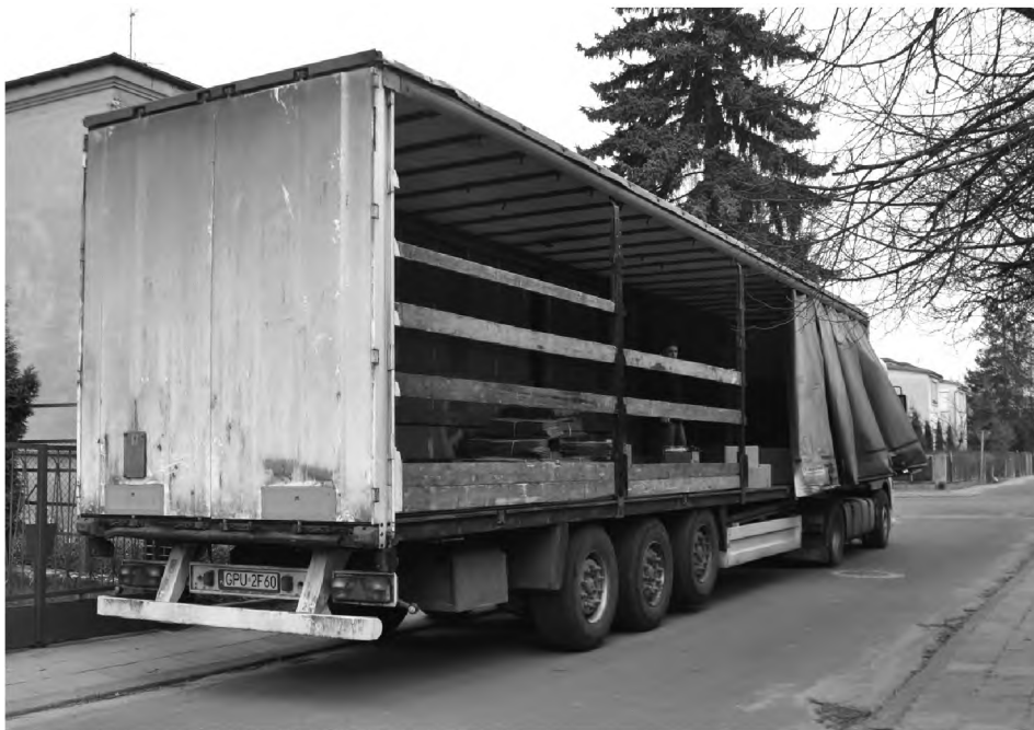
Transport zbiorów prof. G. Labudy

Z początkiem grudnia biblioteka w Luzinie udostępniła grę internetową Gerard Labuda – profesor zwyczajny – człowiek nadzwyczajny . Wśród nagród znalazł się czytnik e-booków 47 .