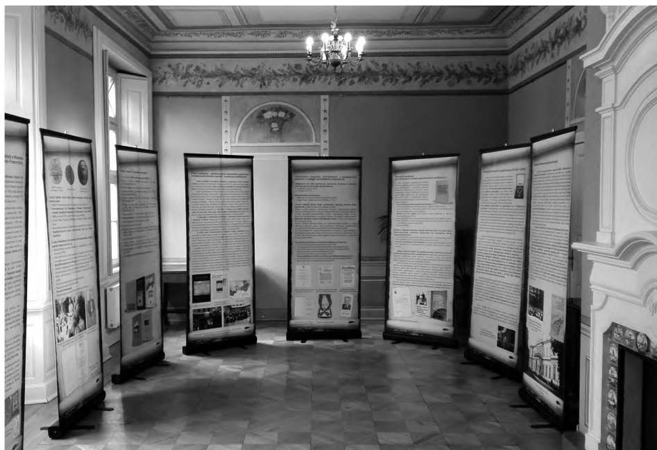
Noc muzeów w wejherowskim muzeum