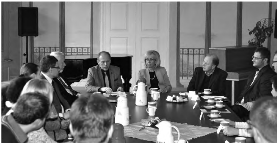
Komitet Obchodów Roku Gerarda Labudy

nym, naukowym oraz upamiętniającym. Prowadzenie sekretariatu obchodów powierzono wejherowskiemu Muzeum 5 .