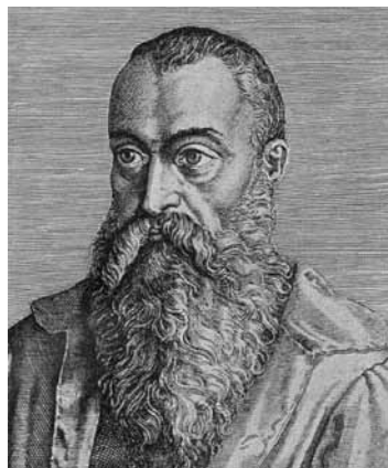
Ryc. 1. Juliusz Caesar Scaliger

Czucie pozycji oraz ruchu w przestrzeni przez nasze ciało zostało po raz pierwszy opisane w 1557 r. przez włoskiego lekarza i filozofa Juliusza Caesara Scaligera, który w jednym ze swoich największych dzieł „ Exotericarum exercitationum ” opisał to zjawisko jako „czucie ruchu”. Scaliger, człowiek renesansu, zagorzale bronił arystotelesowskiego podejścia do nauki, filozofii oraz sztuki. W swoich pracach opierał się na realistycznym i empirycznym podejściu do przyrody oraz ciała człowieka, które „reagowało na zmiany wszystkiego co go otacza (...)”. Jego prace miały wpływ na pojmowanie świata przez takich