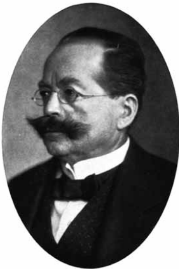
Ryc. 2 Alfred Goldscheider

informacjach, które wyjaśniały, iż informacja aferentna, idąca z zewnątrz do mózgu, pochodzi z różnorodnych struktur, w skład których wchodzi ścięgna, stawy oraz skóra. Swoje przemyślenia oraz twierdzenia zawarł w książce wydanej w 1880 r. i zatytułowanej „The Brain is an Organ of Mind”. Jako zwolennik teorii abiogenezy Bastian utrzymywał, iż był świadkiem spontanicznego utworzenia się żywego organizmu z martwej materii w polu widzenia mikroskopu [Courville 1953].