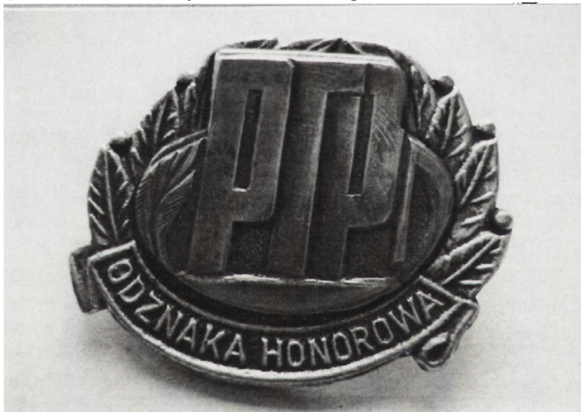
Odznaka Honorowa PTP.

Jednym z cenionych odznaczeń w środowisku pielęgniarskim jest Honorowa Odznaka Polskiego Towarzystwa Pielęgniarskiego przyznawana pielęgniarkom, które swoją postawą i zaangażowaniem wyróżniły się w pracy dla popularyzowania idei Polskiego Towarzystwa Pielęgniarskiego oraz wniosły znaczący wkład w rozwój pielęgniarstwa w środowisku pracy i zamieszkania. Kryteria przyznawania określa regulamin Honorowej Odznaki Polskiego Towarzystwa Pielęgniarskiego.