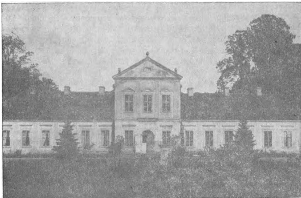
Fot. 2. Sokolniki, woj. kaliskie — pałac, elewacja frontowa