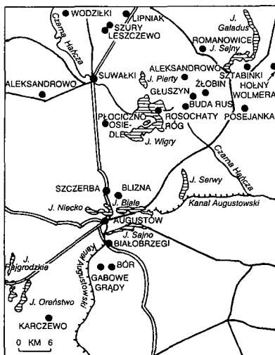
Rys. 1. Miejsca zamieszkania staroobrzędowców w regionach augustowskim i suwalsko-sejneńskim (stan z 1994 r.)

Ważnym wydarzeniem okresu międzywojennego, oddziałującym mocą swoich postanowień na wszystkie środowiska staroobrzędowców w Polsce, było zwołanie w 1925 r. Pierwszego Ogólnopolskiego Zjazdu Staroobrzędowców-Bezpopowców w Wilnie. Zjazd ten powołał Radę Naczelną Staroobrzędowców, która przyjęła obowiązki zarządzania sprawami Kościoła w Polsce między soborami; uchwalono też urzędową nazwę wyznania, obowiązującą do dzisiaj, tzn. Wschodni Kościół Staroobrzędowy nie posiadający hierarchii duchownej.