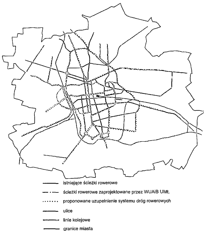
Rys. 2. Projekt systemu dróg rowerowych w Łodzi