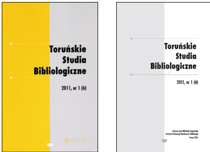
Rys. 2. Okładka i karta tytułowa nr 1(6) TSB z roku 2011.

na okładce numerów z 2010 r., w związku z jubileuszem 65-lecia UMK, zamieszczono okolicznościowy logotyp.