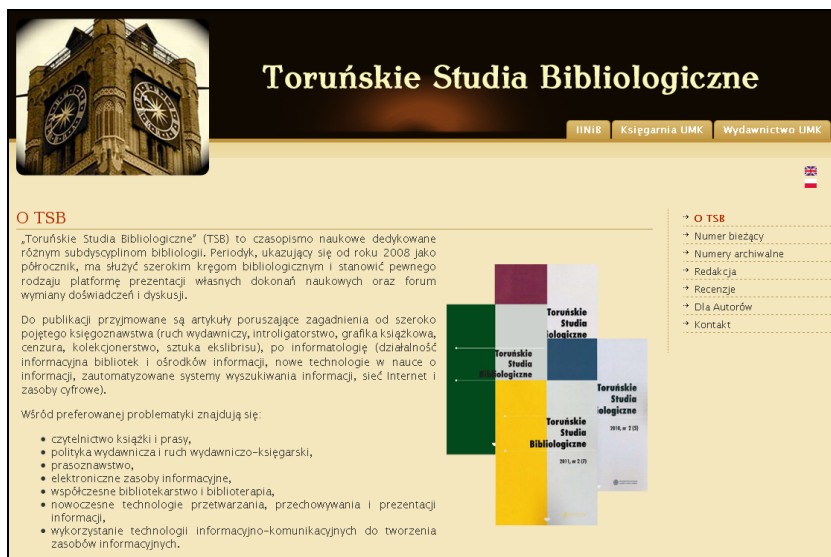
Rys. 4. Strona główna „Toruńskich Studiów Bibliologicznych”.

Czasopismo posiada własną, tworzoną przez zespół redakcyjny, dwujęzyczną (polską i angielską) stronę internetową ( http://www.home.umk.pl/~tsb ). Wszyscy zainteresowani publikowaniem na łamach pisma mogą na niej znaleźć informacje o składzie redakcji, numer bieżący oraz spisy treści numerów archiwalnych, szczegółową instrukcję wydawniczą, odnośniki do baz danych indeksujących periodyk, a także pełnotekstowe wersje numerów.