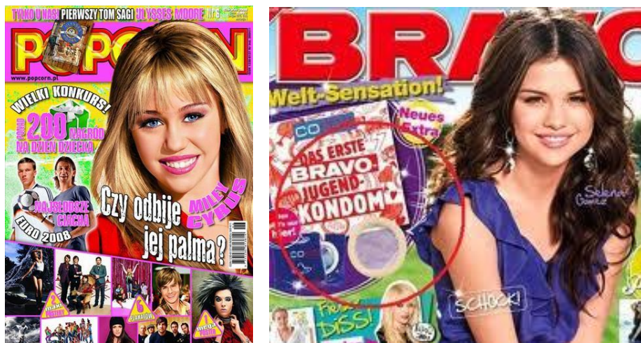
Okładki pism „Popcorn” i „Bravo”.