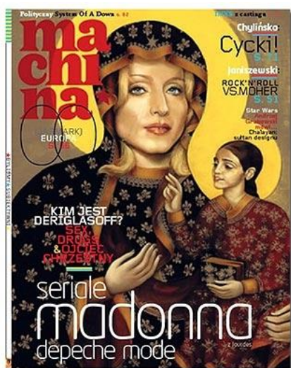
Kontrowersyjna okładka „Machiny”

kwestiami społecznymi i kulturą popularną. Pismo zostało zamknięte z powodu problemów finansowych w 2002 roku. Redakcja robiła wszystko, aby temu zapobiec, stosowała różne rozwiązania, m.in. prowokację, np. publikując na okładce zdjęcie pary gejów. Pismo upadło w atmosferze skandalu. Reaktywacja periodyku miała miejsce w 2006 roku. Jego pojawienie się na rynku prasowym znowu wywołało poruszenie. Na okładce tym razem znalazł się wizerunek matki Boskiej z Jezusem, która miała twarz Madonny, a zamiast Jezusa na jej rękach była córka Madonny. Ten zabieg prowokacyjny spotkał się to z narodowym oburzeniem: „Jesteśmy wstrząśnięci, że używa się cudownego obrazu Matki Boskiej Częstochowskiej do profanacyjnych przekształceń plastycznych i komercyjnych celów reklamowych” 33 .