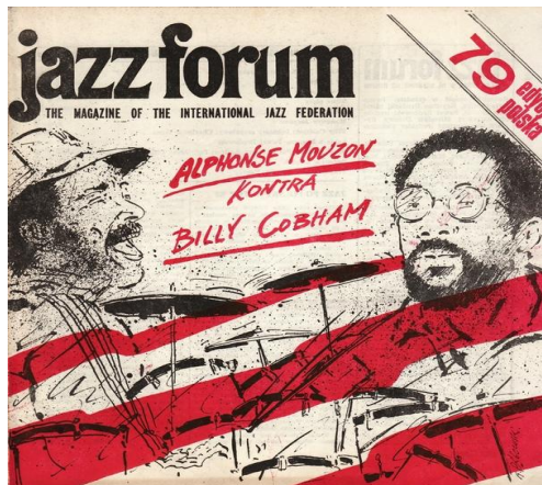
Okładka magazynu „Jazz Forum”