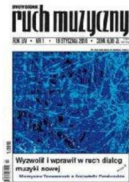
Okładka magazynu „Ruch Muzyczny”

Kolejną przeszkodą w rozwoju prasy polskiej (w tym muzycznej) były lata mrocznej peerelowskiej historii. Informacja była głównym wrogiem totalitarnej władzy. Dlatego komuniści chcieli ją kontrolować, aby izolować społeczeństwo od świata zewnętrznego i łatwiej nim manipulować. Pomimo surowych represji ukazywała się prasa o charakterze muzycznym, np. „Synkopa. Klub miłośników piosenki” (1971–1989). Najważniejszym pismem w polskim świecie muzyki klasycznej był jednak „Ruch Muzyczny” 13 .