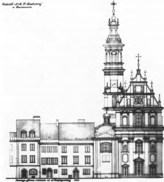
2. Projekt odbudowy kościoła p. w. Matki Bożej Łaskawej – elewacja frontowa, 1947r.

W czasie okupacji, dzięki wcześniejszym dobrym kontaktom z duchowieństwem, bywał zatrudniany przy remontach kościołów i klasztorów, które bardzo ucierpiały wskutek bombardowań. Odbudowywał obiekty ss. Szarytek na Powiślu i oo. Pallotyńów na Pradze, uczestniczył w zabezpieczaniu prowizorycznymi dachami wielu zniszczonych świątyń. Wobec likwidacji przez okupanta wyższych uczelni włączył się wraz z kolegami z Politechniki w tajne nauczanie. Od początku wojny przystąpił do podziemnej organizacji zbrojnej ZWZ-AK. Podczas powstania warszawskiego walczył jako żołnierz VI Obwodu AK na Pradze. Przebywając na terenie starej rzeźni przy ul. Jagiellońskiej, widział jak na drugim brzegu Wisły ginęły zabytki Warszawy.