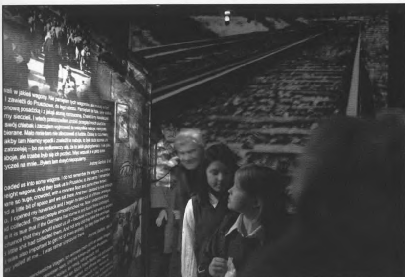
2. Prezentacja wystawy w Muzeum Historycznym m.st. Warszawy, wrzesień 2007 r.