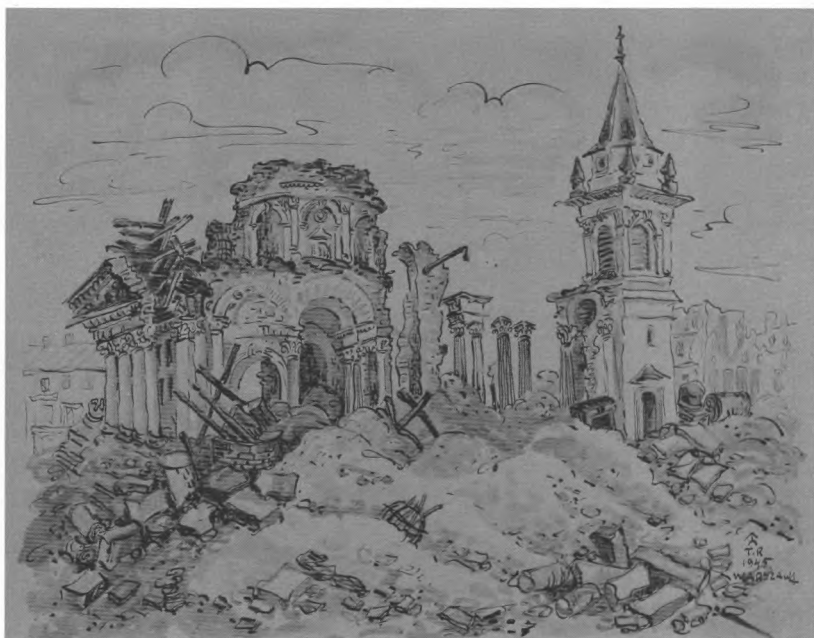
7. Kościół św. Aleksandra, rys. T. Roszkowska

Nr inw. MHW 26023, sygn.: „Aleks.Sochaczewski / Wiedeń kwiecień / 1911”.