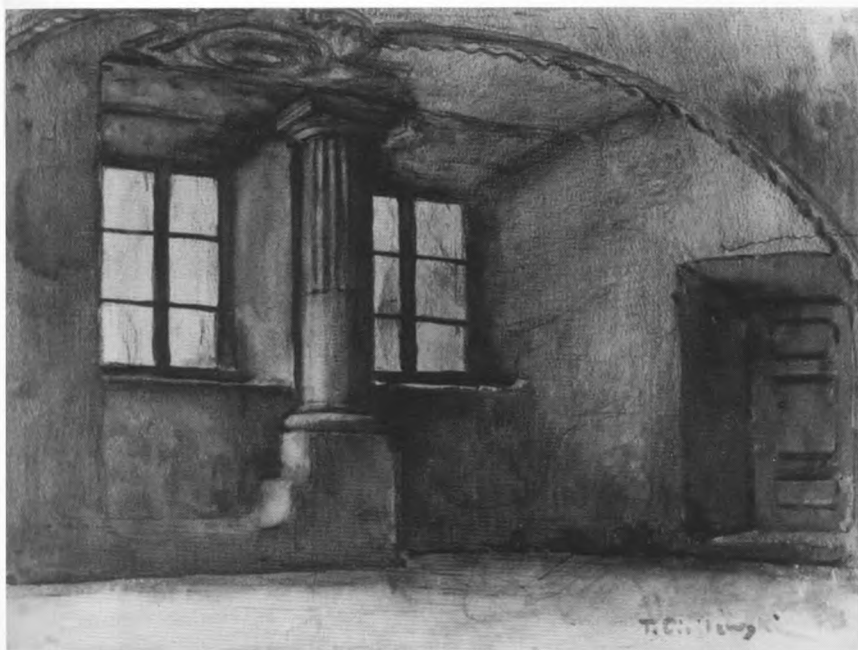
1. Komnata Baryczkowska mal. T. Cieslewski