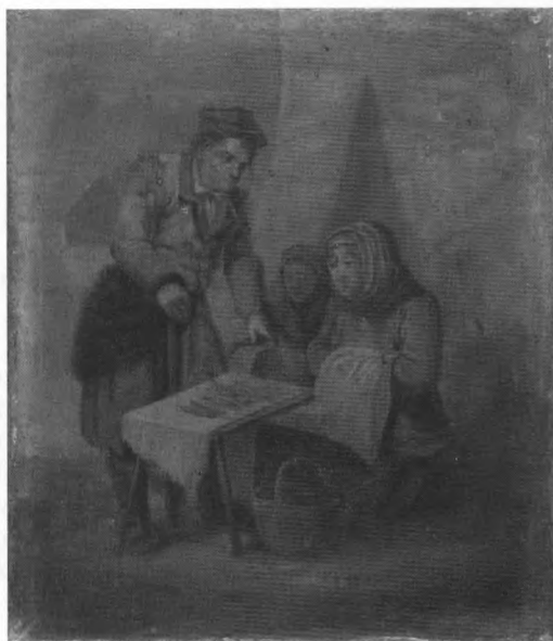
3. Kram z rybami, mal. I. Gepner