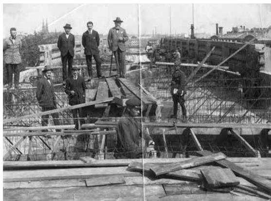
4. Prace remontowe na Zamku Królewskim. Na rusztowaniach stoją (wg opisu na rew.): „od lewej strony – /1. student Stomiszewski /2. budow. Skurewicz /3. [budow.] Zieliński /4. Rupiewicz / niżej /5. [nieczyt.] Prażmowski /6. Ziajowski /7. Kapit. [an] Krupa.”, fot. nn. 1922 rok

Literatura: fotografie opracowano na podstawie dokumentów złożonych w MHW i informacji od darczyńcy.