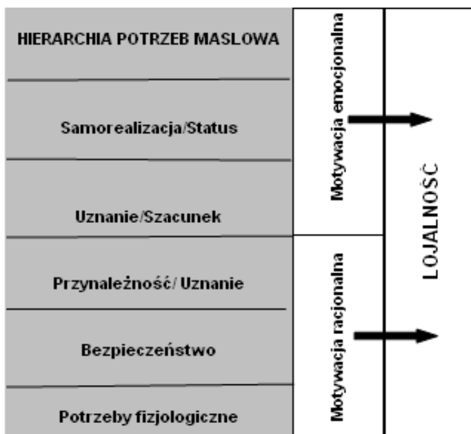
Rysunek 1. Realizacja potrzeb i jej wpływ na lojalność