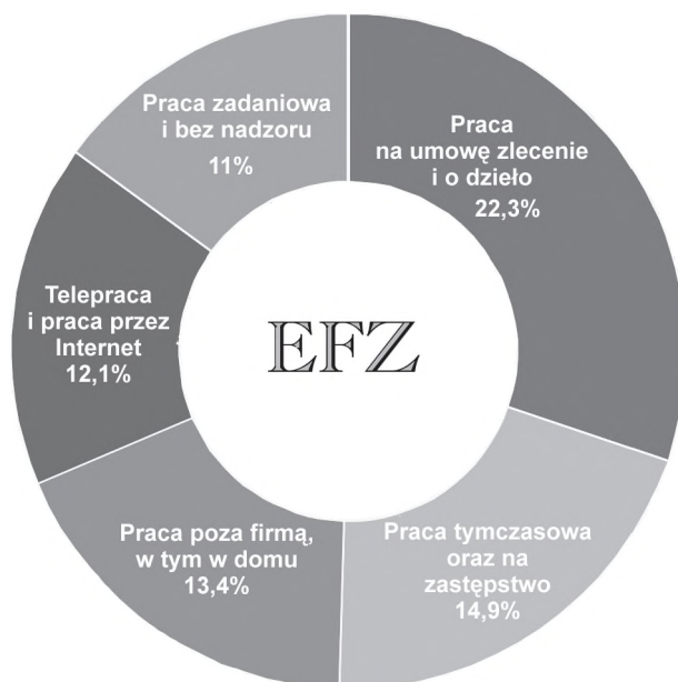
Rys. 3. Kategorie tworzące pojęcie elastycznych form zatrudnienia Categories creation definition of elasticity forms of employment

Przy tak dużej różnorodności odpowiedzi do skonstruowania definicji elastycznych form zatrudnienia, w miarę spójnej z postrzeganiem tego zjawiska przez badanych przedsiębiorców, wykorzystane zostały wyłącznie te cechy, które uzyskały ponad 10% wskazań (por. tab. 1). W takim ujęciu elastyczne formy zatrudnienia wypływające z percepcji badanych są pojęciem bardzo szerokim opierającym się na pięciu głównych filarach: „praca na umowę zlecenie lub o dzieło”, „praca sezonowa lub na zastępstwo”, „praca poza firmą lub w domu”, „praca przez Internet” oraz „praca bez nadzoru”. Każdy z tych filarów posiada dodatkowo dający się określić udział w tworzeniu definicji (por. rys. 3).