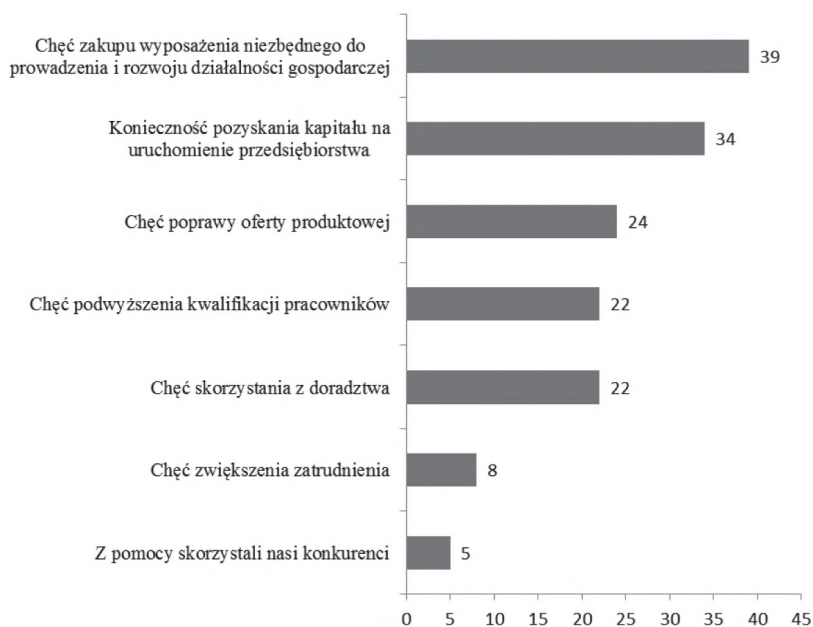
Rysunek 1. Przyczyny współpracy przedsiębiorstw z instytucjami otoczenia biznesu