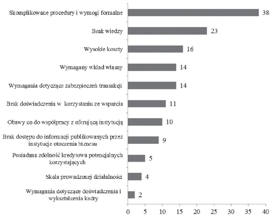
Rysunek 2. Bariery współpracy przedsiębiorstw z instytucjami otoczenia biznesu

Pomimo szerokiej oferty instytucji otoczenia biznesu respondenci dostrzegają pewne bariery w podjęciu współpracy (rysunek 2). Najważniejszym czynnikiem uniemożliwiającym uzyskanie wsparcia są skomplikowane procedury i wymogi formalne (38 wskazań). Ponadto firmy zwracały również uwagę na niewystarczającą wiedzę (23 podmioty). Tego typu ograniczenia są uciążliwe zarówno dla małych przedsiębiorstw, jak i dużych spółek dysponujących znacznymi środkami finansowymi i dostępem do porad prawnych. Jednakże dla nowo powstałych przedsiębiorstw koszty i zniechęcający charakter biurokratycznych utrudnień mogą okazać się niemożliwe do pokonania. W wielu przypadkach przedsiębiorstwa, które mają problem z uzyskaniem wsparcia od instytucji otoczenia biznesu, porzucają plany wejścia na rynek. Zniesienie tych barier może wpłynąć na wykorzystanie licznych możliwości biznesowych, związanych między innymi z wejściem na nowe rynki.