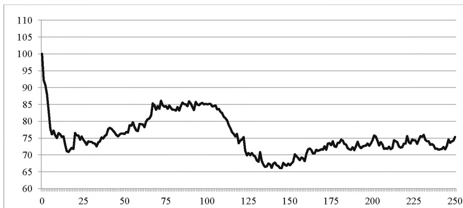
Rysunek 2. Średni kurs akcji po scaleniu

Pozostałe akcje o najniższych możliwych cenach notowały skokowe wahania o 1 grosz. Wśród nich cena FON-u i Elkopu oscylowała między 1 a 2 groszami, Sanwilu 4–5 groszami, a PC Guarda 2–4 groszami. Ponadto akcje Mewy przez cały okres przed scaleniem notowano po cenie 1 grosza (oferty podażowe po cenie 1 grosza nie były nawet zaspokojone).