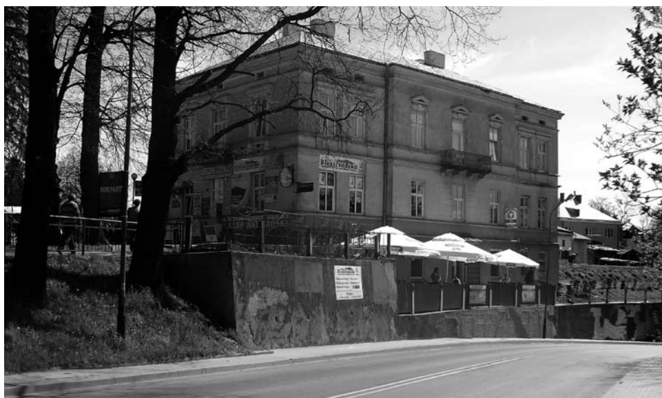
Budynek PUBP/PDdsBP/KP MO/RUSW w Brzozowie przy pl. Grunwaldzkim 5, stan obecny

Zorganizowany w 1957 r. Referat ds. Bezpieczeństwa KP MO w Brzozowie od 1967 r. nazywany był w nomenklaturze bezpieki Referatem ds. SB. Po powstaniu RUSW w Brzozowie w sierpniu 1983 r. w jego strukturach działał Referat SB. Z tego wynika, że w interesującym nas okresie w odniesieniu do brzozowskiej jednostki SB używano trzech terminów – w artykule będziemy posługiwać się nazwą Referat SB (RSB).