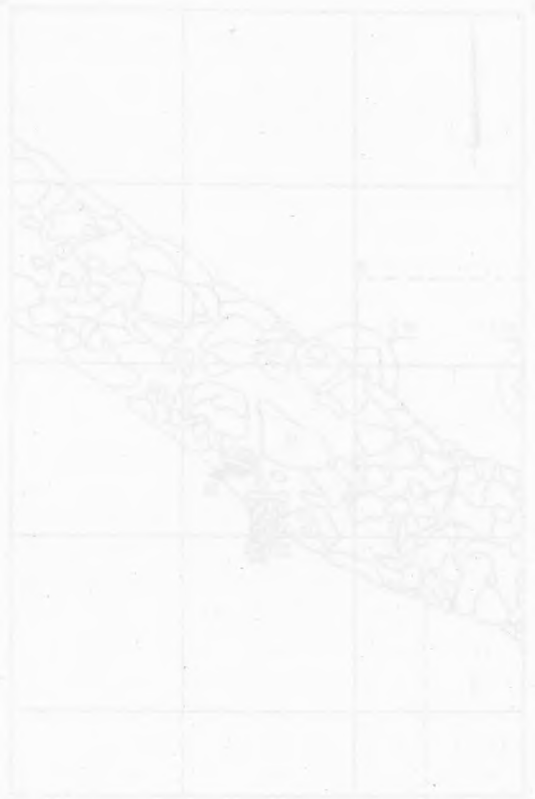
Fig. 1. Wojciechów, plan twierdzy. 1 - mur i bastiony z systemu średnio-wiekowego; 2 - mur i bastiony z systemu nowo-wiekowego. Skala 1:100. Wykopalstwa przeprowadzono w 1977 r.

Wskazywać na to może struktura muru i liczba bastionów. W systemie średnio-wiekowym mur miał grubość 0,9 m i liczył 12 bastionów. W systemie nowo-wiekowym mur miał grubość 1,2 m i liczył 15 bastionów. Wykopalstwa potwierdziły istnienie obu systemów obrony twierdzy w Wojciechowie.