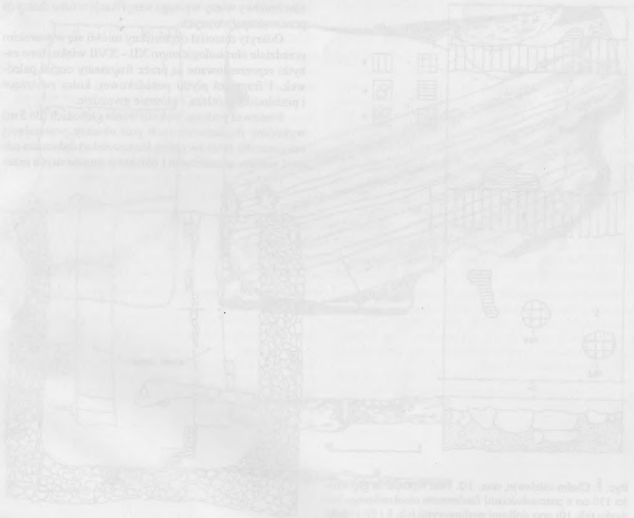
Fig. 1. Plan of the excavation site 144 in Chełm, S. Czarniecki Street. The plan shows the layout of the structures, including the semi-subterranean huts and the timber-post construction. The cross-section on the right illustrates the vertical profile of the structures, showing the ground level, the semi-subterranean floor, and the timber posts.