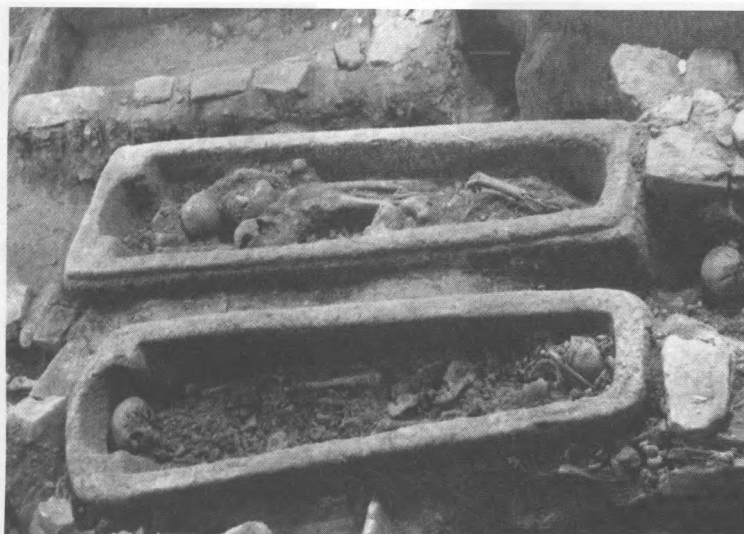
Ryc. 3. Cmentarzysko z fazy II swebsko-wizygockiej oraz III wczesnośredniowiecznej (IX-XI w.) odkryte w podziemiach nawy głównej Katedry Santiago (wg J. Suarez Otero, tamże, s. 84).

prawie wszystkie relikwie wraz z Katedrą w Santiago (budowa Alfonsa III). Tę i inne płyty można oglądać w muzeum katedralnym w Santiago 10 .