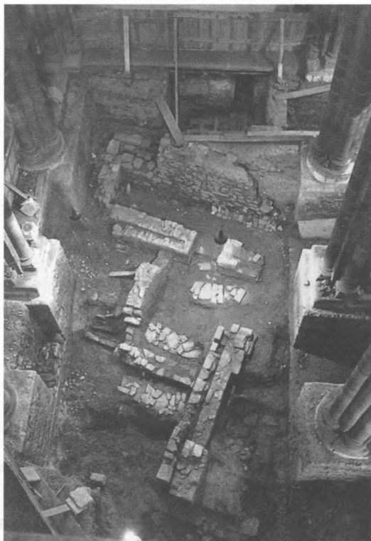
Ryc. 4. Sarkofagi fazy II swebsko-wizygockiej oraz cmentarzysko antyczne i wczesnośredniowieczne w podziemiach Katedry Santiago (wg J. Suarez Otero, tamże, s. 88).