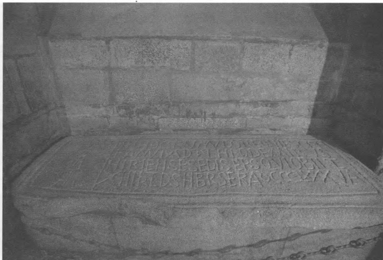
Ryc. 2. Płyta nagrobna Biskupa Irii – Teodomira (ca †847 r.) (wg F. Singul, Urbanismo e Peregrinación na Cidade Apostólica de Santiago durante a Alta Idade, Compostela... , s. 114).

zać można z fundacją Alfonsa III i biskupa Sismondo. Odkryto też pozostałości zbudowanej wcześniej świątyni przez Alfonsa II oraz biskupa Irii – Teodomira (ryc. 1).