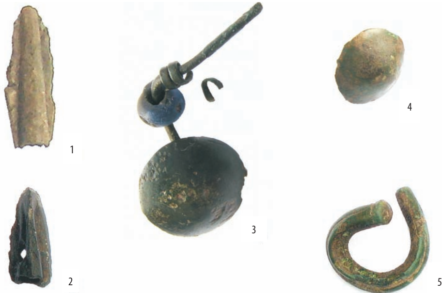
Ryc. 2. Stary Machnów, pow. tomaszowski. Zabytki metalowe (powiększone): 1, 2 – grociki; 3, 4 – kolczyki gwoździowate; 5 – zawieszka skroniowa.