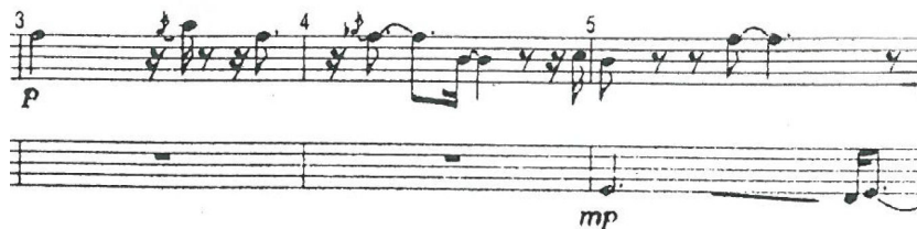
Przykł. 2. Flet (t. 3-5) – górny system: imitacje podmuchów wiatru; dolny system: flet tenorowy – kołyszący się bananowiec

Metalowe ścianki miski, zbierającej wodę spadającą z przeciekającego dachu, wydają pod ich wpływem pojedyncze, delikatne dźwięki tworzące odległości zazwyczaj opadających kwart i sekund. Większe interwały – seksty, oktawy, nony i decymy – pojawiają się, gdy deszcz na chwilę przestaje padać i odległości między spadającymi kroplami się wydłużają aż do chwilowego zatrzymania (pauzy w taktach 23-27). Gwałtowna wichura, o której mowa w wierszu, imitowana przez flet od taktu trzeciego (silnie rytmizowana wznosząco-opadająca linia melodyczna) jest u Kotońskiego raczej łagodnym wiatrem, który ucicha na chwilę przed zatrzymaniem deszczu: