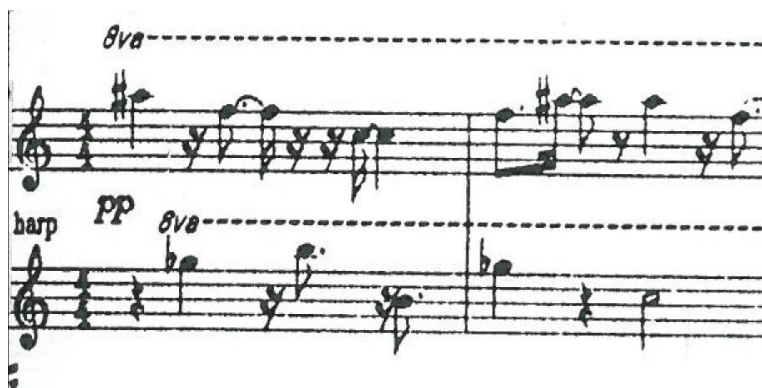
Przykł. 1. Harfa (t. 1-2) – imitacje spadających kropli wody

Kotoński do tego haiku wybrał instrumentację składającą się z fletu, sopranu, harfy i fletu tenorowego 17 . Każdy z instrumentów naśladuje określone elementy przyrody – deszcz, wiatr, drzewo. Rozpoczynająca samotnie utwór harfa, grająca opadające, przerywane pauzami interwały, symbolizuje spadające z różnym natężeniem krople wody: