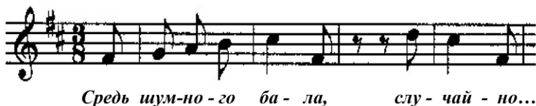
Przykł. 7. Средь шумного бала

Większość miniatur jest tak wyrazista, że nie potrzebuje dodatkowych opisów. Często wykonuje się Słodkie marzenie , choć wymaga większych umiejętności. Warto przypomnieć rysunek z pierwszego wydania, na którym widzimy śpiące dziecko 16 . Jego marzenia przedstawione w formie obrazkowej – to cukiernia, pełna rozmaitych słodkości. Ajzensztadt zwraca uwagę, że melodia przypomina romans Czajkowskiego Средь шумного бала (przykład nr 7). Może to nie przypadek, że miniatura o marzeniach (przykład nr 8) nawiązuje do pieśni o miłości.