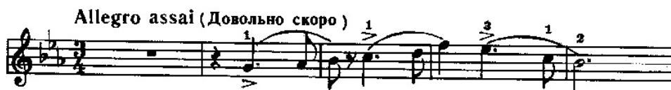
Przykl. 6. Walc

Najcenniejszy walor tego cyklu stanowi warstwa obrazowa, dostosowana do potrzeb i możliwości młodego pianisty. Czajkowski przekazał dźwiękami obrazy ze świata dziecka, jego zabawy, fantazje, marzenia, ale również scenki z codziennego życia.