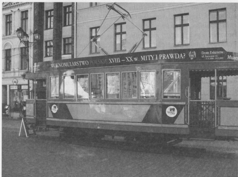
Zabytkowy tramwaj reklamujący wystawę.