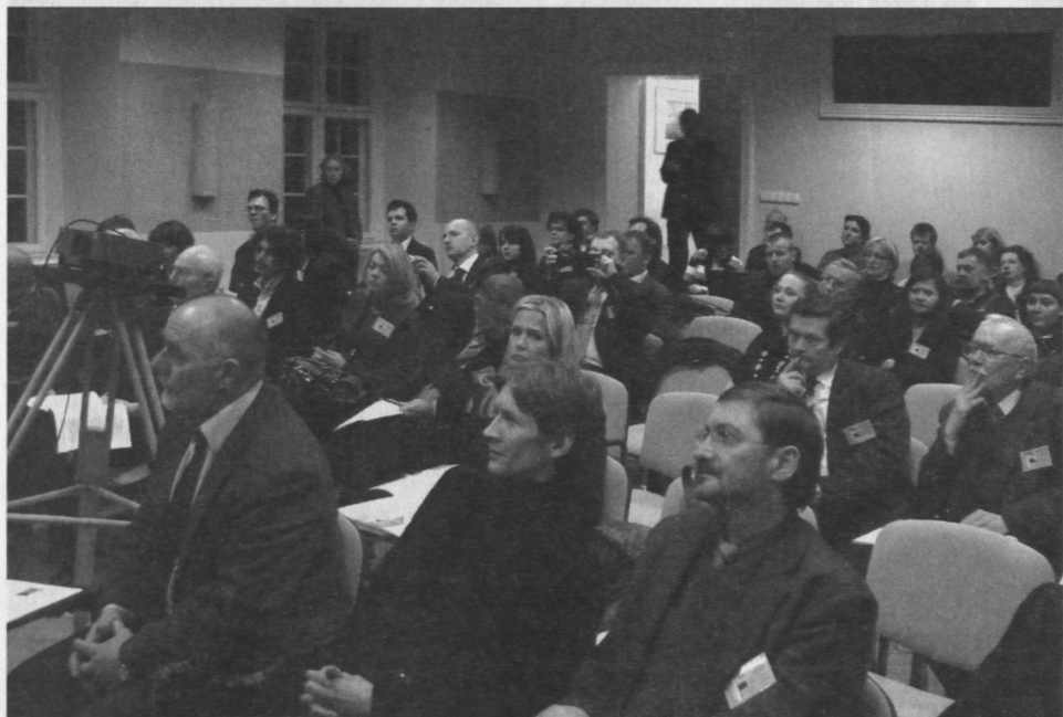
Uczestnicy drugiego dnia konferencji.

„Muzy” pojawiały się podczas obrad konferencji nie tylko jako przedmiot uczonych dysput. Organizatorzy dali bowiem uczestnikom możliwość bezpośredniego zetknięcia się z różnymi manifestacjami idei wolnomularskich w sztuce. Wspomnieć tu przede wszystkim należy o wystawie Wolnomularstwo polskie XVIII-XX w. Mity i prawda? przygotowanej przez Muzeum Okręgowe w Toruniu, a której otwarcie w październiku 2008 roku stało się bezpośrednim impulsem do zorganizowania konferencji. Na wystawie zaprezentowano wyposażenie łóż, elementy ich dekoracji, czy też klejnoty i odznaki lożowe, szkło używane podczas rytualnych biesiad, także liczne dokumenty, w ich liczbie historyczne i współczesne, dyplomy wolnomularskie. Toruńską ekspozycję wraz z towarzyszącym jej katalo-