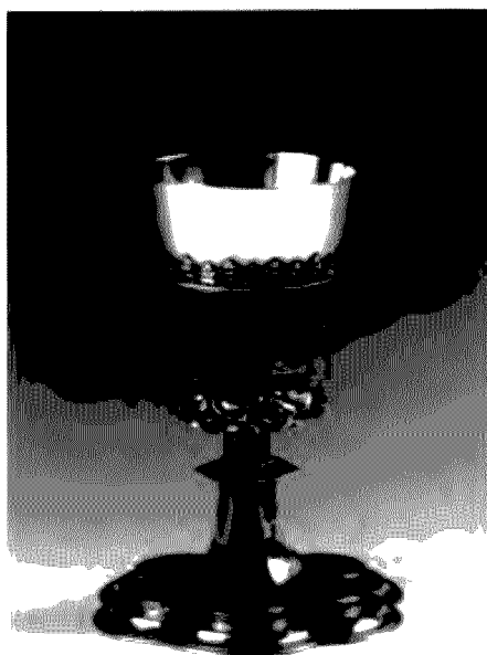
Ilustracja nr 2

czary naczynia zdobi ornament ułożony z płatków niebieskiej, zielonej i pomarańczowej emalii (ilustracja nr 2). W dolnej partii trzonu zamieszczono w owalu, przedstawienie zmartwychwstałego baranka, także skomponowane z emalii. Stopa kielicha pokryta jest grawerowanymi łacińskimi napisami. Drugie naczynie z początku XVII wieku wypełniają inne dekoracje. Dolna część czary wyłożona jest mozaiką z pociętego na kwadratowe kostki szkła, stopę kielicha pokrywają, wykonane ze srebra, ażurowe sceny Zwiastowania, Bożego Narodzenia, Pokłonu Trzech Króli, starca Symeona, Obrzezania i wizerunek Świętej Rodziny.