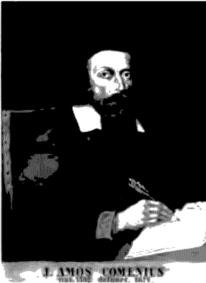
Jan Amos Komeński. Portret z galerii portretów rektorów gimnazjum w Lesznie