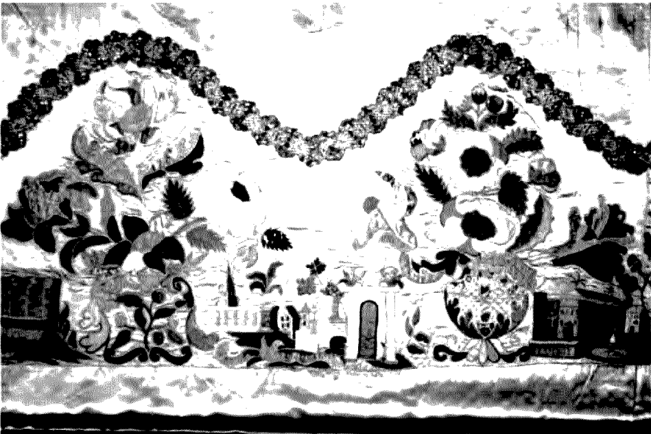
Ilustracja nr 1

Z Herrnhut powróciły również naczynia liturgiczne używane w kościele św. Jana. Na szczególną uwagę zasługują, wykonane ze złoczonego srebra, kielichy. Najstarszy, renesansowy kielich datowany jest na 1564 roku (data wygrawerowana jest na wewnętrznej stronie stopy). Dolną część