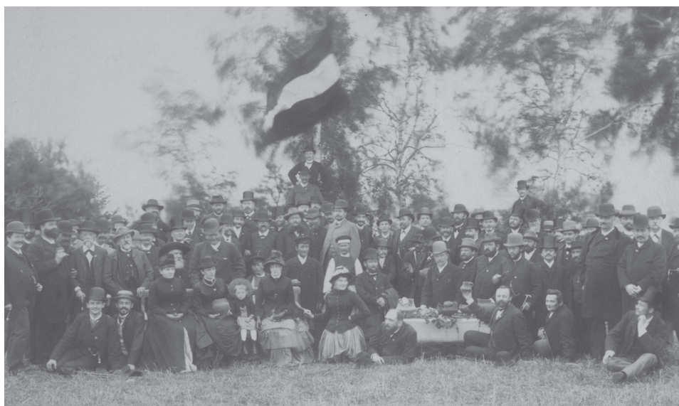
Il. 2. Niemieckie Towarzystwa Historyczne i Starożytnicze w Poznaniu (1888)

działalności można raczej określić jako swego rodzaju zinstytucjonalizowany klub rodzinny poznaniaków i łodzian, nadal wahali się, czy używać starych metod pozytywistycznej Landesgeschichte, czy popadłej trochę w niełaszkę Volksgeschichte. Mimo ambitnych planów komisji jej naukowe wyniki były dość ograniczone.