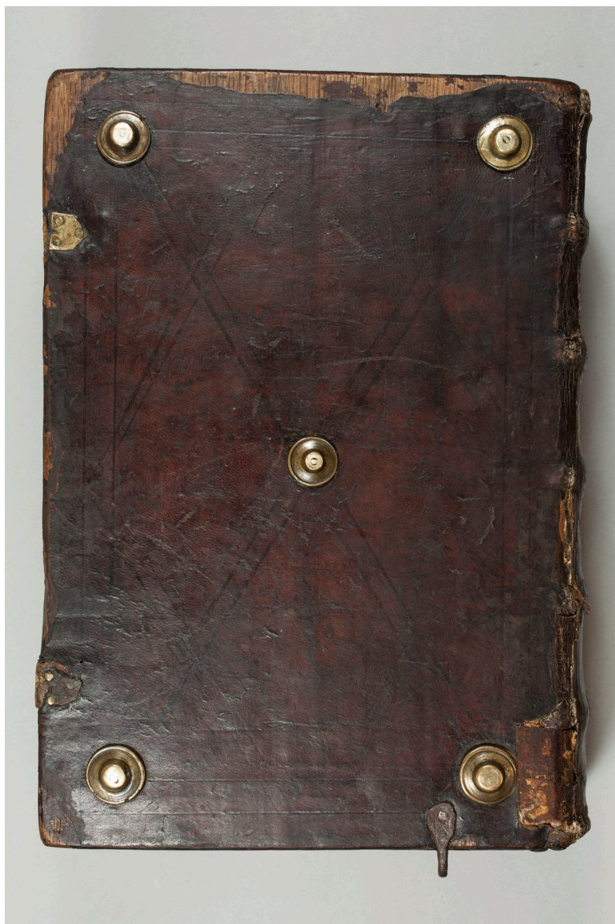
Il. 4. Johannes Januensis de Balbis, Catholicon . Tylna część oprawy z żelaznym kółkiem u dołu – pozostałość po inkatenacji książki