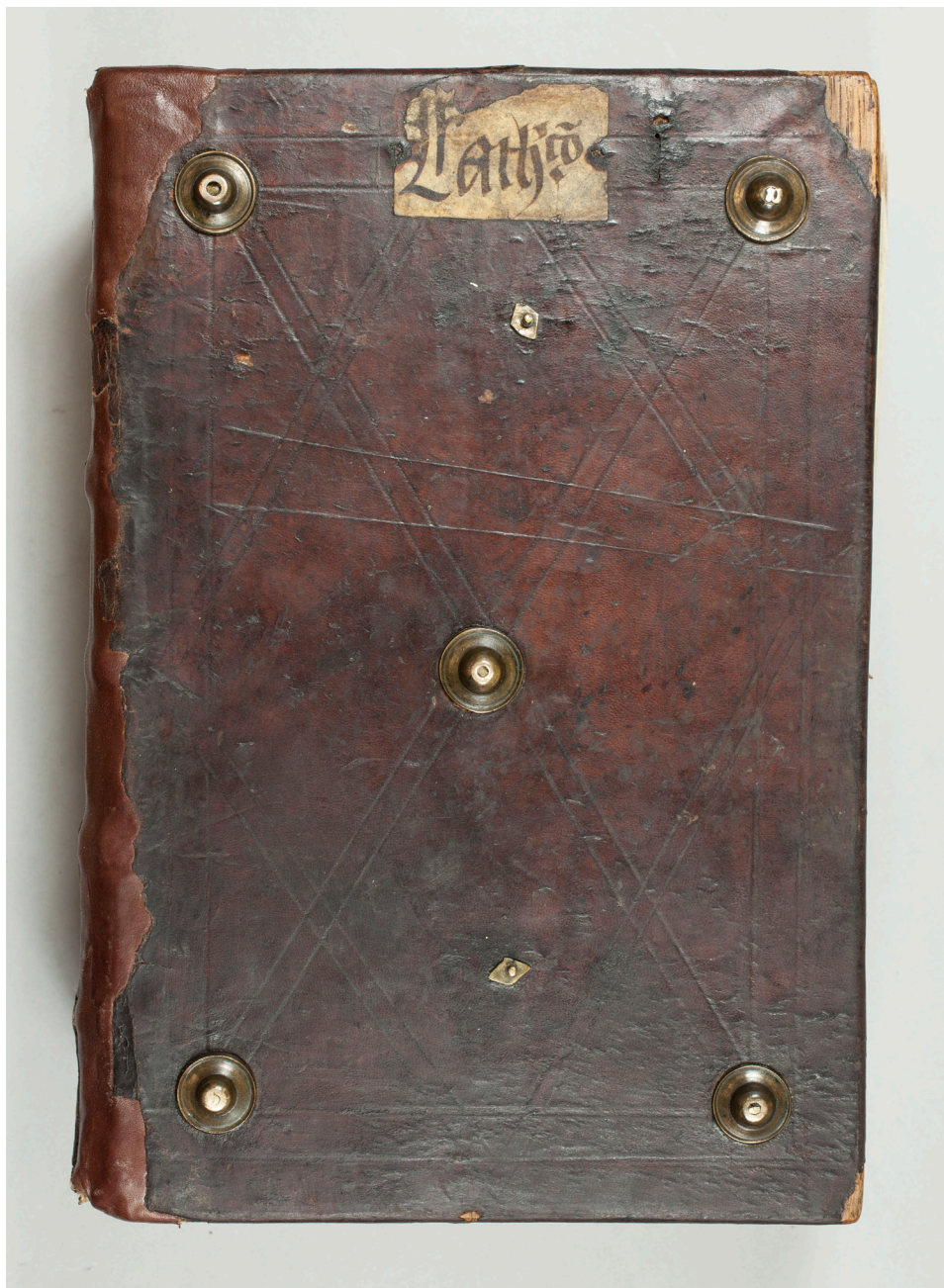
Il. 1. Johannes Januensis de Balbis, Catholicon Źródło: Biblioteka Uniwersytecka w Poznaniu, Rkp. 1717.