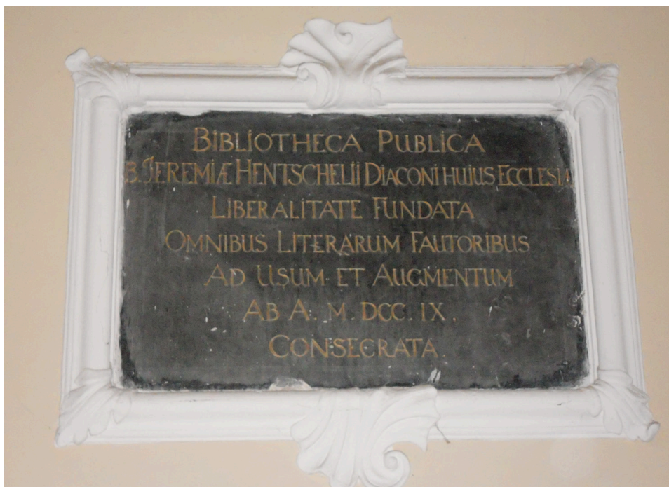
Il. 1. Tablica nad drzwiami biblioteki w kościele św. Krzyża w Lesznie