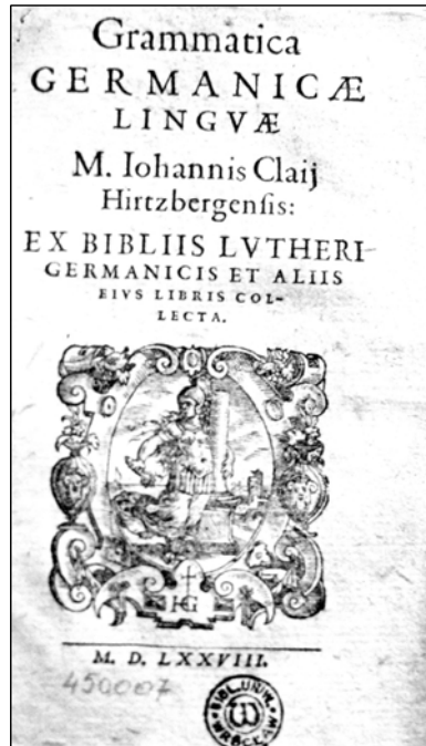
Rys. 1. Karta tytułowa starego druku

oraz niejednorodny sposób określania i zapisu dat; modyfikowała się także sama pisownia oraz system interpunkcyjny. Ręczny sposób tłoczenia wpływał na uszkodzenia składu typograficznego, co uwidacznia się dzisiaj m.in. w wydaniach wariantowych. Zachowane stare druki w wielu przypadkach są zdefektowane, dzieła wielotomowe bywają skompletowane z różnych edycji, zdarzają się klocki wydawnicze oraz introligatorskie. W tej sytuacji konieczne stało się ustalenie zasad opisu w formacie MARC, które będą uwzględniać specyfikę książek wydawanych w okresie XVI-XVIII wieku.