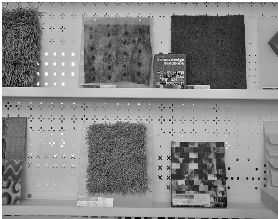
Fot. 3. Design Academy w Eindhoven (Holandia).