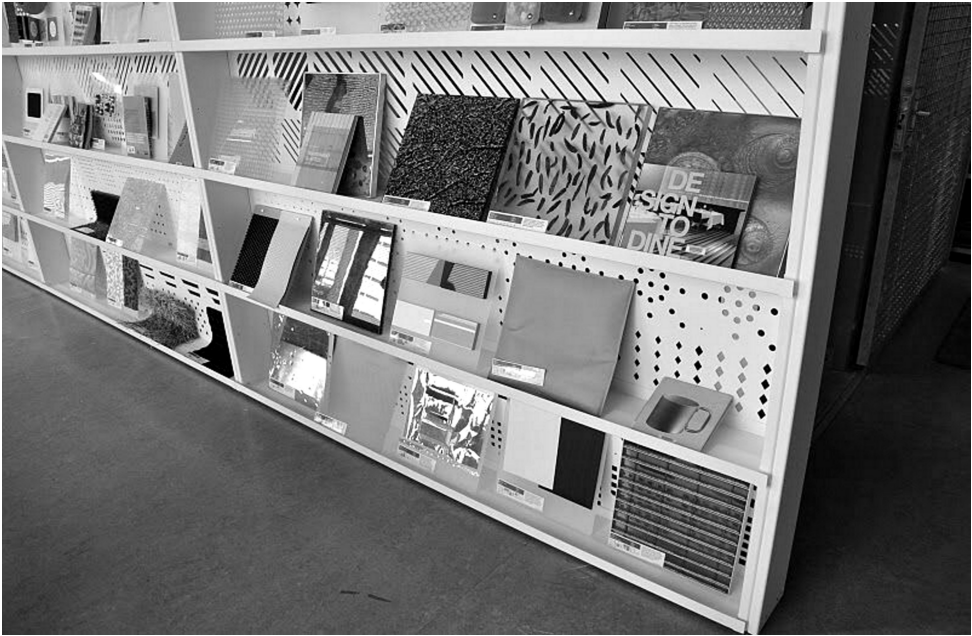
Fot. 1. Design Academy w Eindhoven (Holandia).

Zazwyczaj biblioteki naukowe „kształtują swoje zbiory [dokumentów życia społecznego – B. Firla] w oparciu o tradycję historyczną lub konieczność archiwizowania unikalnych materiałów odnoszących się do rodzimej placówki” (Firlej-Buzon, 2002, s. 97). Tak jest też w przypadku uczelni artystycznych. Większość zbiorów „szarej literatury” pochodzi „z ich własnego łona” – stanowią je dokumenty związane z działalnością poszczególnych twórców skupionych wokół uczelni, z organizowanymi imprezami, wykładami, spotkaniami, jak również warsztatami i plenerami. Tego typu zbiory są niezwykle ważne, ponieważ dokumentują życie środowiska artystycznego. W przeciwieństwie do archiwum, które zajmuje się zbieraniem materiałów powstałych w kancelariach i biurach, biblioteka gromadzi różnego rodzaju druki (Flis, 1970, s. 82). Z tego wynika, że biblioteka może być jedynym miejscem, w którym przechowywane są np. katalogi wystaw, zaproszenia, plakaty, programy konferencji itp., tym bardziej że niektórzy z artystów nie przechowują dorobku swojej pracy, a plakaty czy zaproszenia, czasami projektowane na prośbę kolegi, traktują jako sprawę drugorzędną. Plakat, ulotka czy zaproszenie często nie są przez twórców uważane za dzieła wartościowe, nie są przez nich doceniane i w kon-