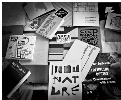
Fot. 1. Książki wydane przez Kronikę