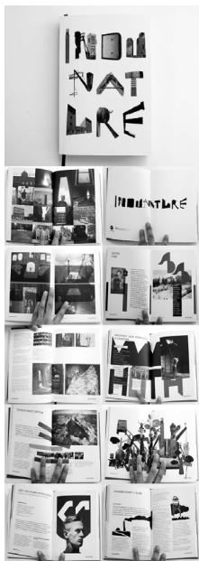
Fot. 3. Projekt „Indunature”

Powstała książka jest zbiorem refleksji teoretycznych na temat projektu architektonicznego Oskara Hansena, a jej design uzupełniony reprodukcjami wszystkich plakatów – trzonu projektu, jest uzależniony od wartości merytorycznej.