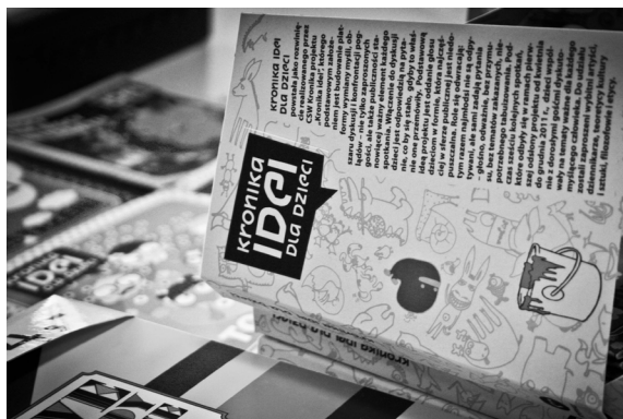
Fot. 4. Kronika idei dla dzieci