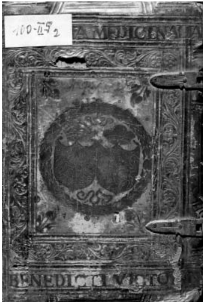
II. 1. Okładzina przednia 100-II-P 2 .