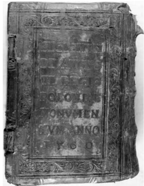
II. 2. Okładzina tylna 100-II-P 2 .

skiego, który pełnił funkcję astronoma, matematyka i lekarza na dworze Zygmunta Augusta jak również Anny Jagiellonki. Niewątpliwie królowa musiała darzyć go sympatią, skoro ofiarowała mu niektóre książki medyczne. Drugi wpis: Ex Libris Congregationis Missionis Domus Stradomiensis ad Cracoviam jak również owalna pieczęć z napisem [CONGREGATIONIS MISSIONIS] DOMUS STRADOMIENSIS CRACOVIAE wskazuje na kolejnego właściciela, jakim stał się dom stradomski w tekście powyżej „stradomski” zawsze mała litera [Płaszczyńska 2009, s. 87; Płaszczyńska 2013, s. 75–76]. Drugi druk królewski to również klocek o sygnaturze 29-III-B, gdzie na przedniej oprawie znalazł się II rodzaj ekslibrisu królewskiego oraz skrócony tytuł dzieł w nim zawartych: HILDEGARDIS PHYSICA ET NICOLAI MYREPSI ANTIDOTARIVM, a w zwierniadle tylnej okładziny umieszczono formułę własnościową i datę oprawienia: SIGISMUNDI AVGUSTI REGIS POLONIAE MONVMENTVM 1552. [Płaszczyńska 2009, s. 88; Płaszczyńska-Herman 2013, s. 77]. Superekslibris występujący na tym druku w katalogu A. Kaweckiej-Gryczowej oznaczony jest numerem II [Kaweczka 1998, s. 27].