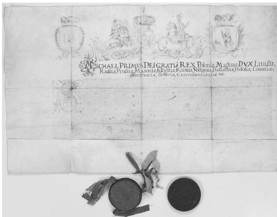
II. 2. F101-82. Dokument, w którym Michał Korybut Wiśniowiecki, król polski i wielki książę litewski, potwierdza wszystkie przywileje nadane przez jego poprzedników miastu Wilnu oraz jego mieszkańcom. Kraków, dn. 3 października 1669 r.

Ważny dla miasta dokument – to pismo Zygmunta I Starego z 14 grudnia 1522 r., w którym potwierdza on umowę zawartą pomiędzy Janem z książąt litewskich, biskupem wileńskim, a magistratem w sprawie podziału jurysdykcji w mieście Wilnie (F101-22). Zachował się fragment pieczęci wielkiej litewskiej.