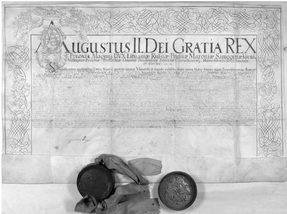
II. 4. F101-93. Dokument, w którym August II, król polski i wielki książę litewski, potwierdza wszystkie przywileje nadane przez jego poprzedników wileńskiemu cechowi cyrulików-chirurgów. Warszawa, dn. 18 marca 1713 r.