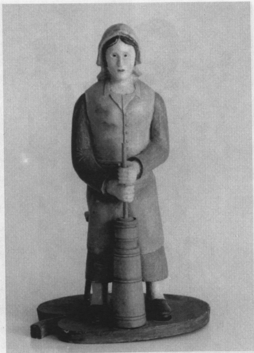
Baba z kierzanką.