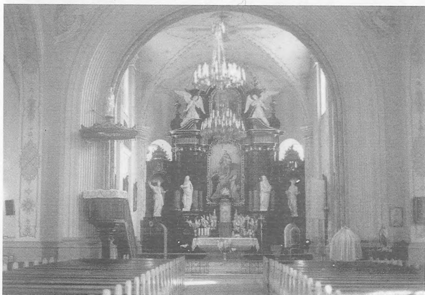
Kościół w Bieżuniu. Wnętrze nawy głównej. Fot. B. Hardygóra-Michewicz, 1999 r.