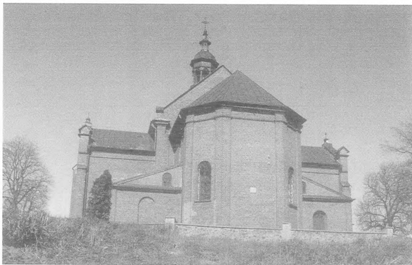
Kościół w Bieżuniu. Fot. J. Piotrowski, 2000 r.