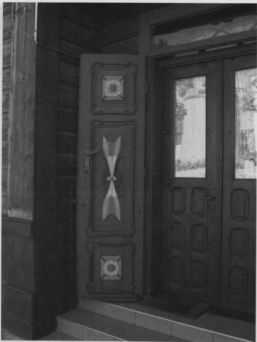
Zdobienia drzwi, ul. Żeromskiego, Sierpc.