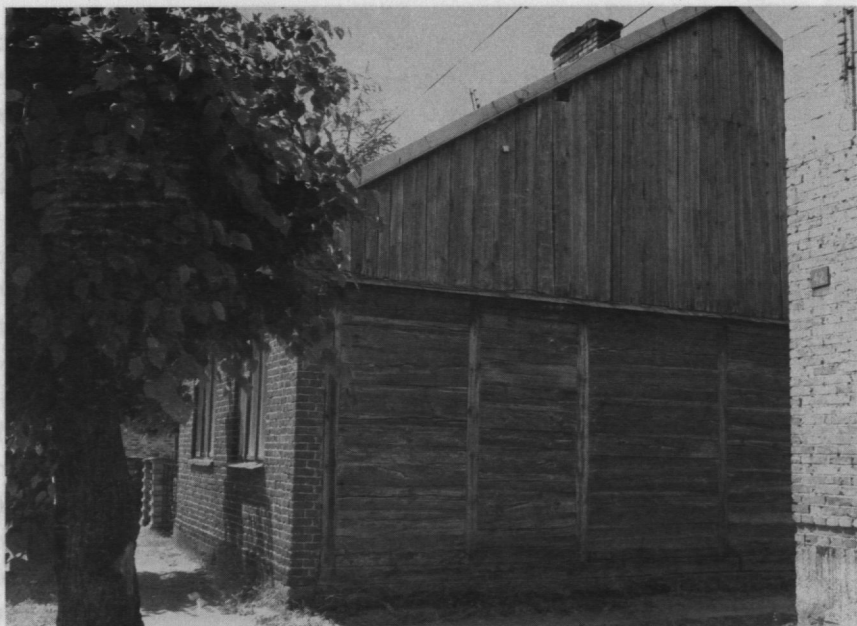
Dom z murowanym frontonem, ul. Sierpecka, Biezuń.

i w Sierpcu. Oprócz tego niektóre z zachowanych sierpeckich chałup posiadają bardzo wysoką podmurówkę, inne natomiast mają pierwszą kondygnację murowaną, piętro zaś drewniane. W obu wypadkach mamy również do czynienia z próbą ominięcia przepisów. Nie należy jednak zapominać o tym, że mieszkańcy Bieżunia – ze względu na niezamożność – otrzymali zgodę na wznoszenie domów drewnianych. 6