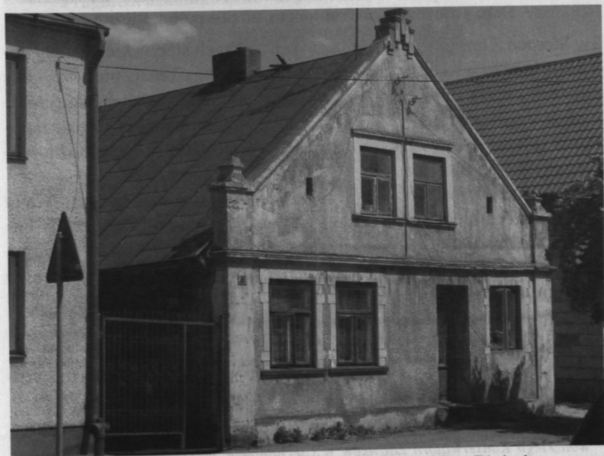
Dom z murowanym frontonem, ul. Warszawska, Biezuń.