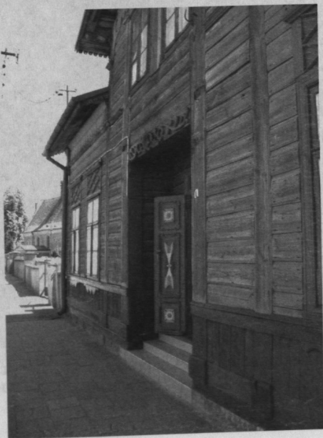
Podcień wnekowa, ul. Żeromskiego, Sierpc.