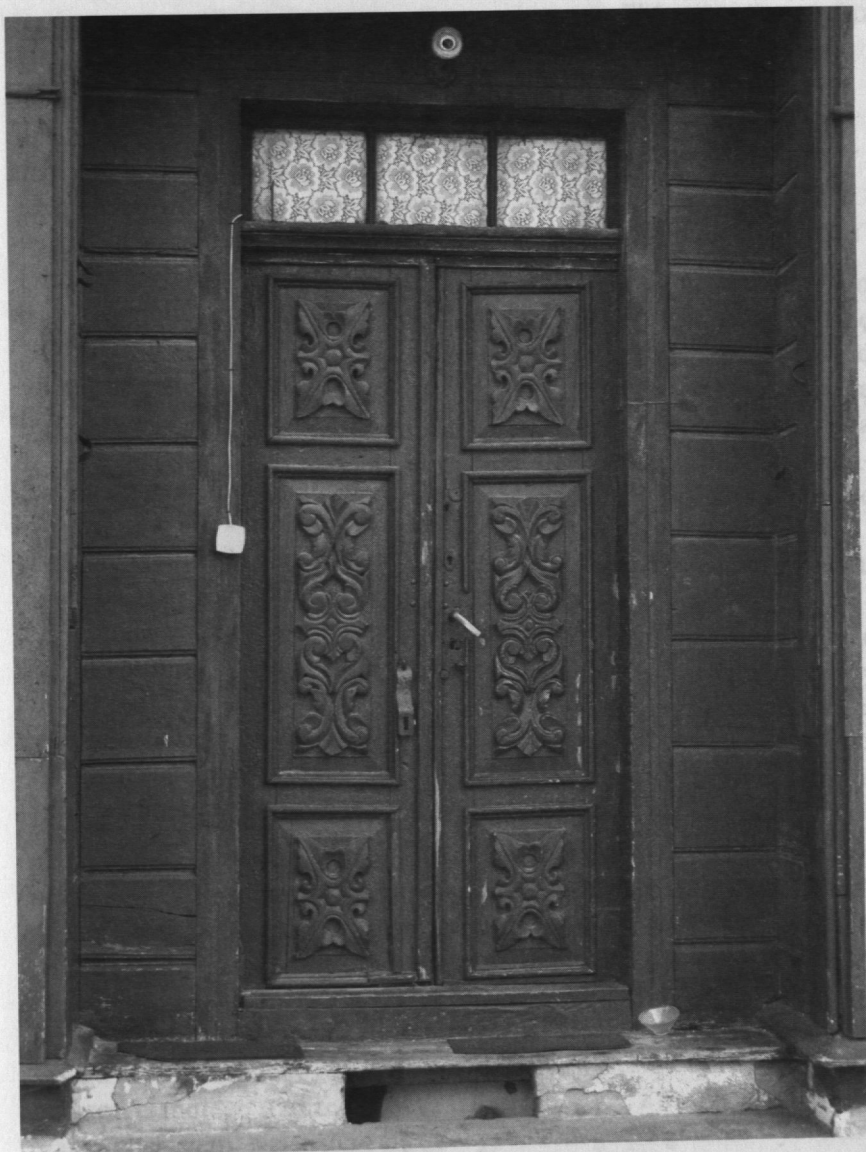
Zdobione drzwi budynku przy ulicy Farnej w Sierpcu.