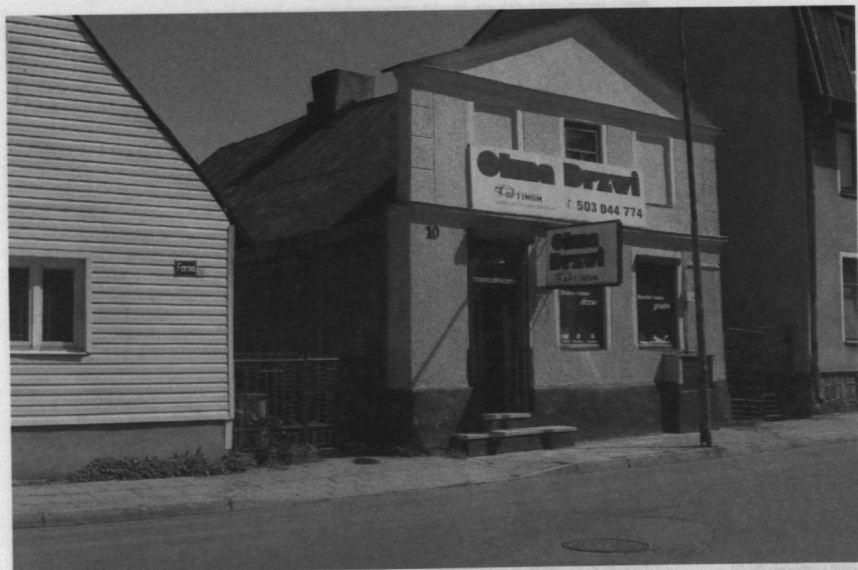
Dom z murowanym frontonem, ul. Farna, Sierpc.