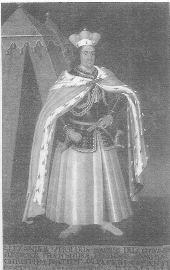
Wielki Książę Litewski Witold. Portret, Litwa (?), XVII/XVIII w.; Wilno, Lietuvos Dailes Muziejus.