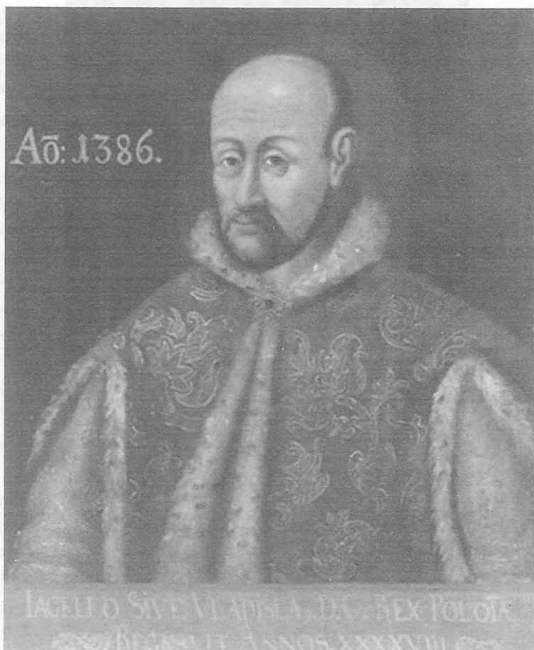
Anonim, Władysław Jagiełło. Portret, ok. 1645 r., Muzeum Okręgowe w Toruniu.