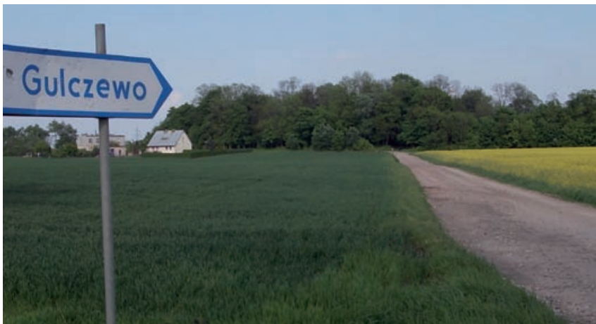
Gulczewo – kolebka Sieprskich

Rodzina Sieprskich ma swoje początki w Gulczewie (dawniej Gólczewie) położonym w parafii Imielnica. W 1982 roku Imielnica została włączona do Płocka, a Gulczewo (Stare i Nowe) leży tuż za granicą rozrastającego się miasta.