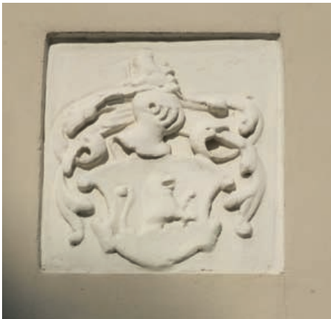
Sierpc – kartusz z herbem Prawdzic