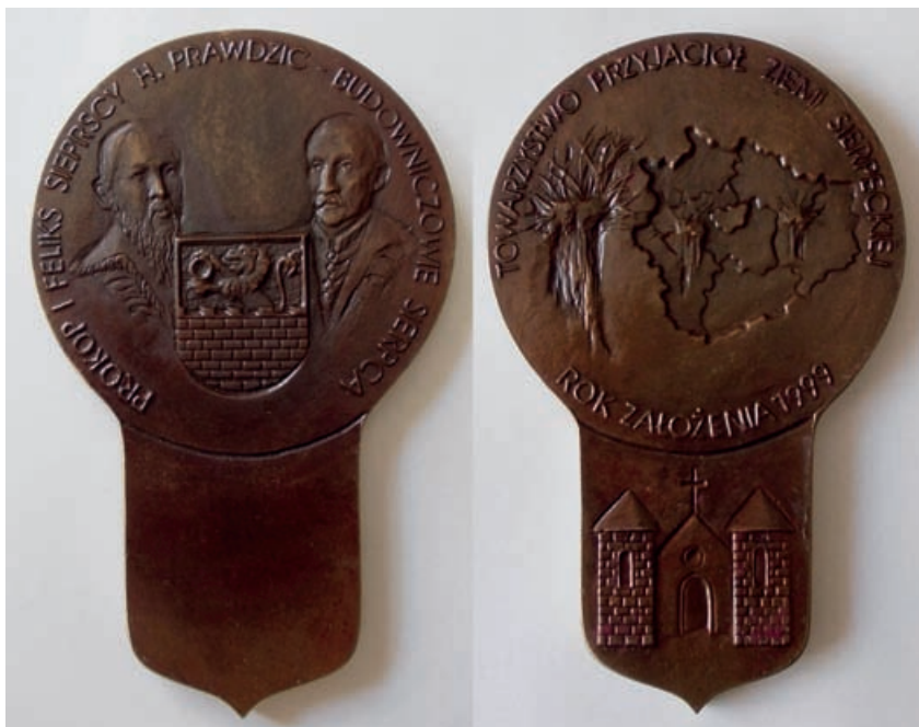
Medal „Pro Domo Sua”