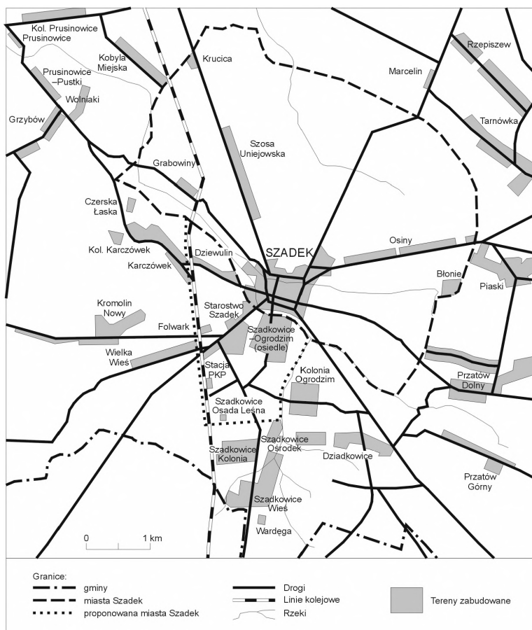
Rys. 3. Propozycja zmiany przebiegu granic Szadku