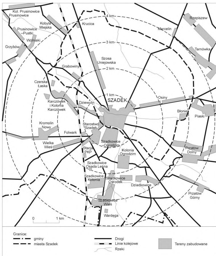
Rys. 1. Odległość fizyczna i czasowa od rynku w Szadku terenów zabudowanych miasta i sąsiednich wsi

przestrzennym ludności. Ponad 80% mieszkańców miasta skoncentrowane jest w jego centralnej części (rynek i otaczające tereny) obejmującej nie więcej niż 5% powierzchni Szadku i zlokalizowanej tuż przy jego południowej granicy administracyjnej. Pozostałe obszary to jednostki satelitarne, w stosunku do centrum wyraźnie mające odmienny charakter, o zabudowie podmiejskiej lub wiejskiej, w niektórych przypadkach nie pozostające w ciągłości przestrzennej z miastem (Grabowiny).