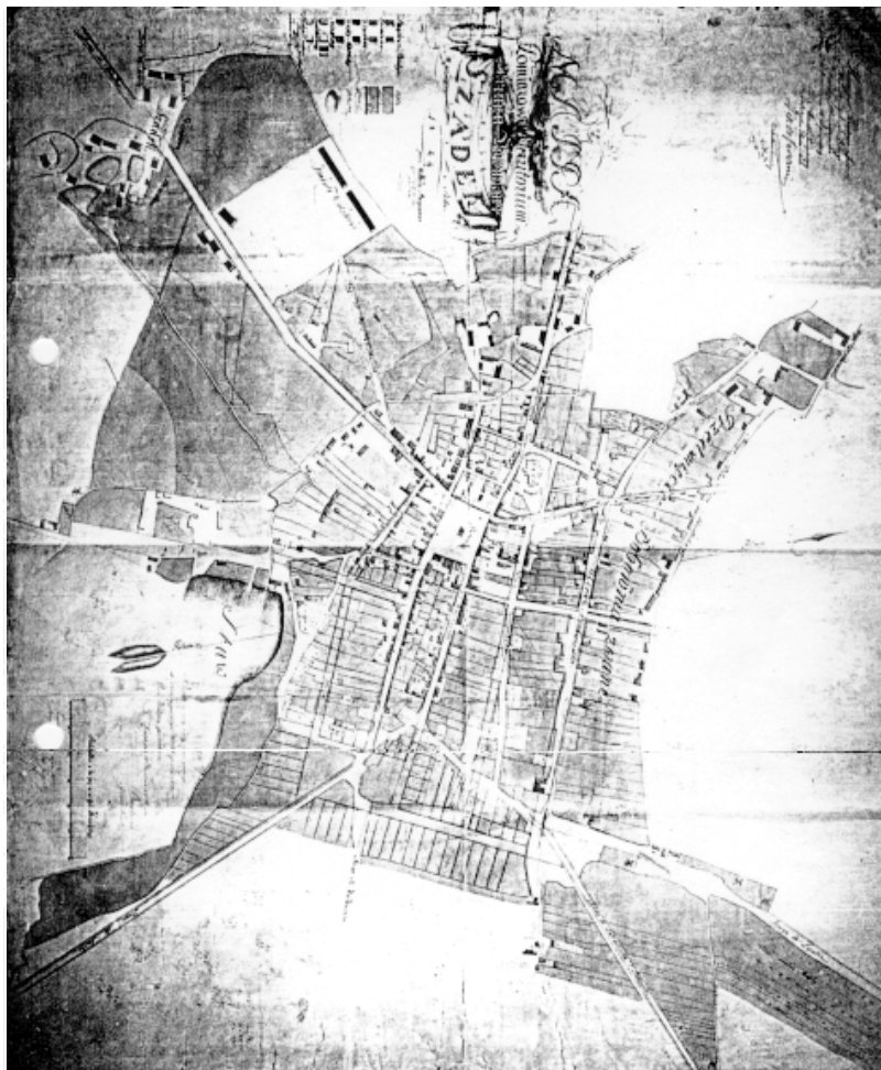
Rys. 1. Szadek, plan miasta z 1824 r.

samym charakterystyczne cechy danemu ośrodkowi i często wpływały na ich oblicze (małe miasta rolnicze).