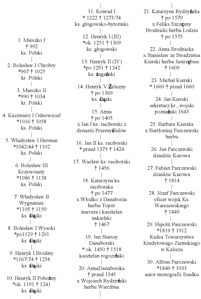
Ryc. 4. Pochodzenie Alfonsa Parczewskiego od Mieszka I

Linia krwi, obrazująca pochodzenie danej osoby od wybranego, ciekawego z jakichś względów przodka, jest bardzo atrakcyjną i przyciągającą uwagę formą prezentacji genealogii.