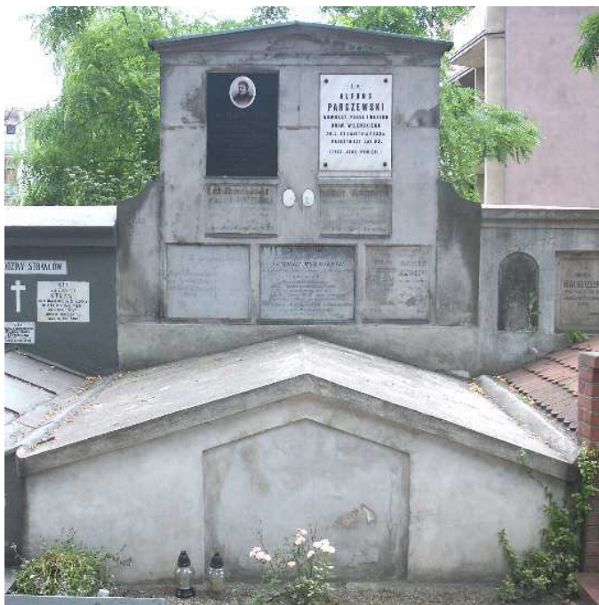
Fot. 1. Nagrobek Parczewskich w Kaliszu (stan z lipca 2006 r.)

jest złożenie w grobowcu doczesnych szczątków samego A.P. w 1933 r. Jest to zatem jeden z najstarszych nagrobków znajdujących się na tym cmentarzu, który został założony w 1807 r. Na podstawie inskrypcji nagrobnych, pochodzących łącznie z 9 tablic, konfrontując je z informacjami z literatury, można odtworzyć krąg najbliższych przodków, krewnych A.P. Inskrypcje zwykle podają imiona rodziców osób pochowanych w tym nagrobku, co umożliwia ich powiązanie.