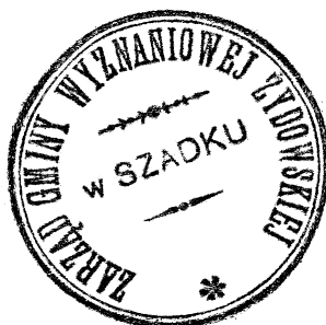
Fot. 1. Pieczęć Zarządu gminy żydowskiej w Szadku z okresu po I wojnie światowej

Najstarsza wzmianka na temat ludności żydowskiej w Szadku pochodzi z 1507 r. 1 i dotyczy zapłaty przez miejscowych Żydów 5 zł podatku koronacyjnego na rzecz króla Zygmunta I Starego. Wtedy też prawdopodobnie po raz pierwszy pojawili się w mieście wyznawcy religii mojżeszowej – niestety nie wiemy, czy zamieszkali tu na stałe, a kolejne informacje o Żydach szadkowskich pochodzą dopiero z pierwszej połowy XVII w.