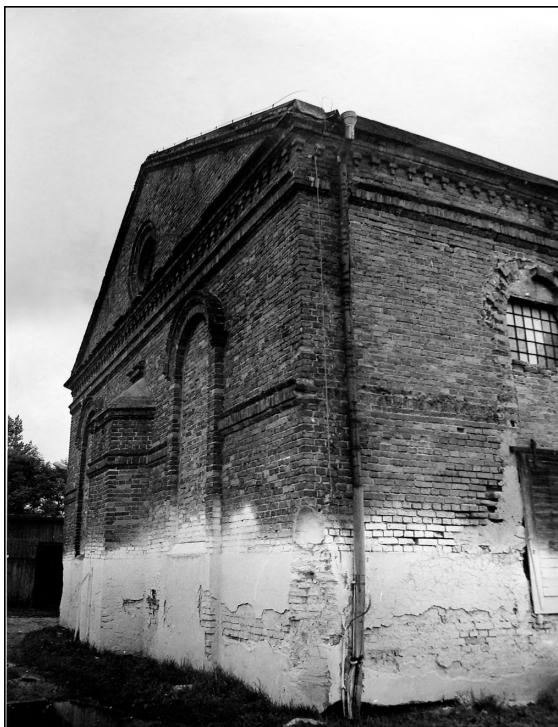
Fot. 6. Ściana wschodnia synagogi w Szadku, z niewielką trójboczną zamkniętą absydą, 1987

Żydów tu pochowanych oraz pomordowanych podczas zagłady i pozbawionych godnego pochówku. Na ten cel J. Opatut przeznaczył 100 tys. dolarów.