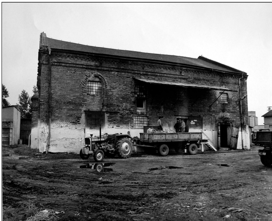
Fot. 5. Synagoga w Szadku, 1987