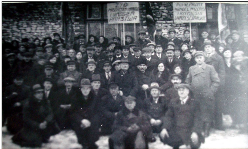
Fot. 3. Manifestacja członków Stronnictwa Narodowego w Szadku, lata trzydzieste XX w.