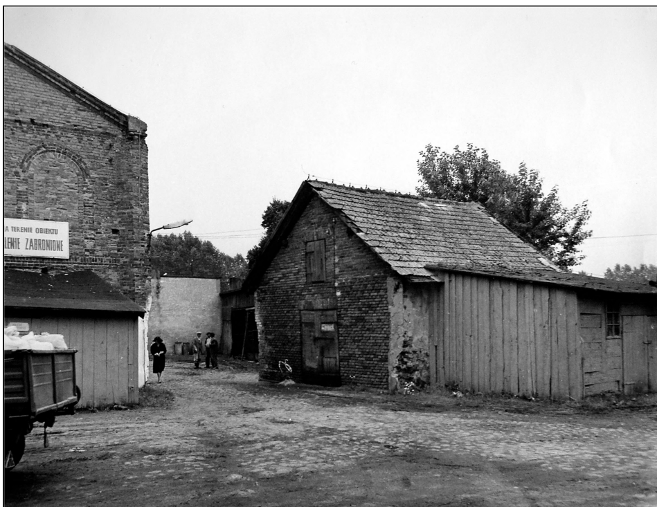
Fot. 7. Mykwa w Szadku, 1987