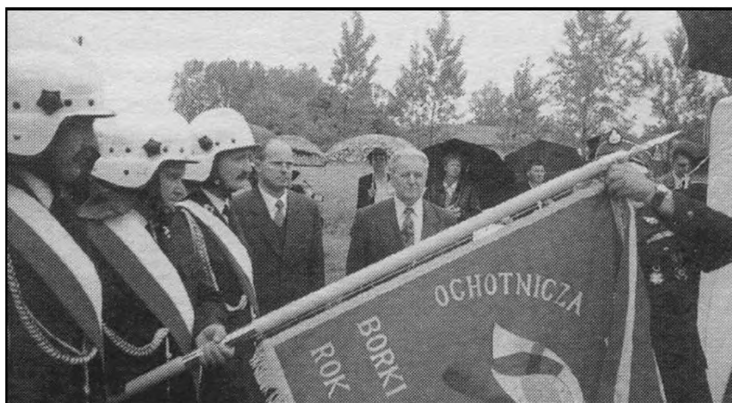
Fot. 3. Odznaczenie sztandaru OSP Borki Prusinowskie brązowym medalem „Za Zasługi dla Pożarnictwa” 2000 r.

Ochotnicza Straż Pożarna w Borkach Prusinowskich powstała w 1946 r. 23 Jednostka dysponowała beczkowozem oraz dwiema sikawkami ręcznymi wraz z podstawowym osprzętem, który do pożarów dowożono chłopskimi wozami konnymi. Brak środków finansowych powodował, że dopiero w 1964 r. powstała remiza, a w 1968 r. zakupiono motopompę (M 400). W 1982 r. jednostka zakupiła nową motopompę (M 800). W lipcu 1997 r. OSP obchodziła jubileusz pięćdziesięciolecia istnienia 24 . Za środki finansowe, pozyskane z organizacji zabaw, strażacy zakupili sprzęt – w 2001 r. do remizy trafił samochód pomocniczy Żuk, a w cztery lata później bojowy Star 244. W 2000 r. odbyła się uroczystość przekazania przez mieszkańców sztandaru, który został odznaczony brązowym medalem „Za Zasługi dla Pożarnictwa” (fot. 3). Przy tej okazji srebrne medale „Za Zasługi dla Pożarnictwa” otrzymało 3 strażaków, zaś brązowe – 8 druhow 25 .