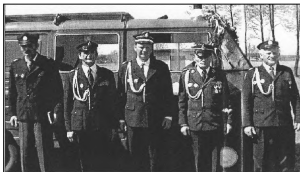
Fot. 4. Drużyna OSP w Szadkowicach podczas poświęcenia wozu bojowego Żuk 2001 r.

Jednostka Ochotniczej Straży Pożarnej w Kobyli Miejskiej powstała w marcu 1967 r. 28 Druhowie mieli do dyspozycji przechowywaną w prywatnym budynku gospodarczym motopompę M 400. 23 sierpnia 1970 r. oddano do użytku strażnicę. W 1975 r. wysłużoną motopompę zastąpiła nowa (M 800), przekazana przez Rejonową Komendę Straży Pożarnej. Druhowie dwukrotnie (w 1992 r. i 1994 r.) organizowali gminne zawody sportowo-pożarnicze. Liczebność druhowów od momentu założenia aż do połowy lat dziewięćdziesiątych nie spadała poniżej 20 czynnych członków (fot. 5). Od połowy ostatniego dziesięciolecia XX w. działalność liczącej ok. 20 druhowów jednostki OSP w Kobyli Miejskiej słabła. Nieodnawiany obiekt strażnicy niszczał, jednostce brakowało podstawowego wyposażenia i własnego środka transportu.