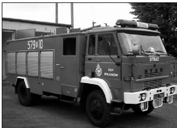
Fot. 1. Wóz bojowy Star 244, należący od 1987 r. do OSP Wilamów

W grudniu 1929 r. z inicjatywy mieszkańców utworzono Ochotniczą Straż Pożarną w Krokocicach 17 . Druhowie wyposażeni byli jedynie w sikawkę ręczną, przechowywaną w drewnianym magazynie. W 1932 r. zapadła decyzja o budowie strażnicy – w tym celu zaciągnięto długoterminową pożyczkę i przystąpiono do gromadzenia niezbędnych materiałów. Jednak budowa ruszyła dopiero cztery lata później, a obiekt ostatecznie ukończono i oddano do użytku w 1939 r. 18 . Podobnie jak inne jednostki, działalność OSP w Krokocicach w czasie okupacji została zawieszona. Po odzyskaniu niepodległości na wyposażenie jednostki trafił zaprzęg konny, a wysłużoną sikawkę zastąpiła motopompa. Na początku lat siedemdziesiątych strażacy wybudowali w Krokocicach sztuczny zbiornik wodny, natomiast w sąsiednim sołectwie Lichawa dwie zastawki na rzece Pisi. System ten na wypadek większych pożarów miał usprawnić zaopatrzenie w wodę. Lata siedemdziesiąte to czas szczególnie aktywnej działalności jednostki – blisko 30 jej członków zaangażowało się w przeprowadzenie modernizacji strażnicy, organizację zabaw i występów aktorów z łódzkich teatrów. W 1996 r. jednostka otrzymała samochód bojowy Star 25. Dwa lata później obchodzono jubileusz siedemdziesięciopięcioletnia OSP w Krokocicach. Z tej okazji 25 strażaków zostało odznaczonych złotymi, srebrnymi i brązowymi medalami „Za Zasługi dla Pożarnictwa” 19 . Początek XXI w. przyniósł częściową odnowę strażnicy i pewne ożywienie