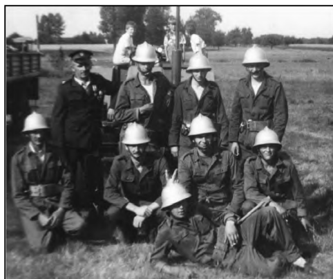
Fot. 5. Drużyna OSP w Kobyli Miejskiej

Jednostka Ochotniczej Straży Pożarnej w Kobyli Miejskiej powstała w marcu 1967 r. 28 Druhowie mieli do dyspozycji przechowywaną w prywatnym budynku gospodarczym motopompę M 400. 23 sierpnia 1970 r. oddano do użytku strażnicę. W 1975 r. wysłużoną motopompę zastąpiła nowa (M 800), przekazana przez Rejonową Komendę Straży Pożarnej. Druhowie dwukrotnie (w 1992 r. i 1994 r.) organizowali gminne zawody sportowo-pożarnicze. Liczebność druhowów od momentu założenia aż do połowy lat dziewięćdziesiątych nie spadała poniżej 20 czynnych członków (fot. 5). Od połowy ostatniego dziesięciolecia XX w. działalność liczącej ok. 20 druhowów jednostki OSP w Kobyli Miejskiej słabła. Nieodnawiany obiekt strażnicy niszczał, jednostce brakowało podstawowego wyposażenia i własnego środka transportu.