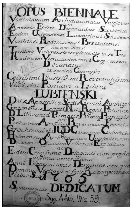
Fot. 1. Karta tytułowa akt wizytacji kanonicznej archidiaconatu uniejowskiego i terytorium wieluńskiego z lat 1761–1763

tarz) 12 . Natomiast podobne pod względem wielkości były dwie biblioteki parafialne w pobliskim dekanacie stawiszynskim: w Borkowie (42 pozycje) 13 i Zborowie (37 pozycji) 14 .