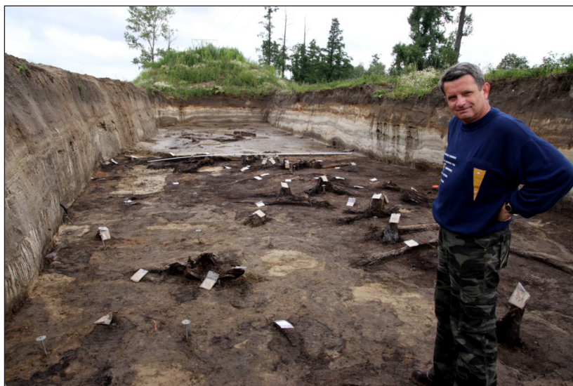
Fot. 4. Kopalny las sprzed ok. 12 000 lat odkryty w zachodniej części doliny Warty w miejscowości Koźmin

globalnego ocieplenia wywołanego wzmożoną emisją dwutlenku węgla na skutek działalności człowieka. Należy nadmienić, że stanowisko z kopalnymi pniami jest unikatowe w skali europejskiej, dlatego prowadzone prace są finansowane ze środków Narodowego Centrum Nauki (grant badawczy N N306 788 240 pt. „Warunki paleogeograficzne funkcjonowania i destrukcji późnowistuliańskiego lasu w dolinie Warty”) w Katedrze Badań Czwartorzędu UŁ we współpracy ze specjalistami z AGH w Krakowie, Wydziału Leśnego SGGW w Warszawie, Instytutu Botaniki PAN w Krakowie oraz Instytutu Geologii UAM.