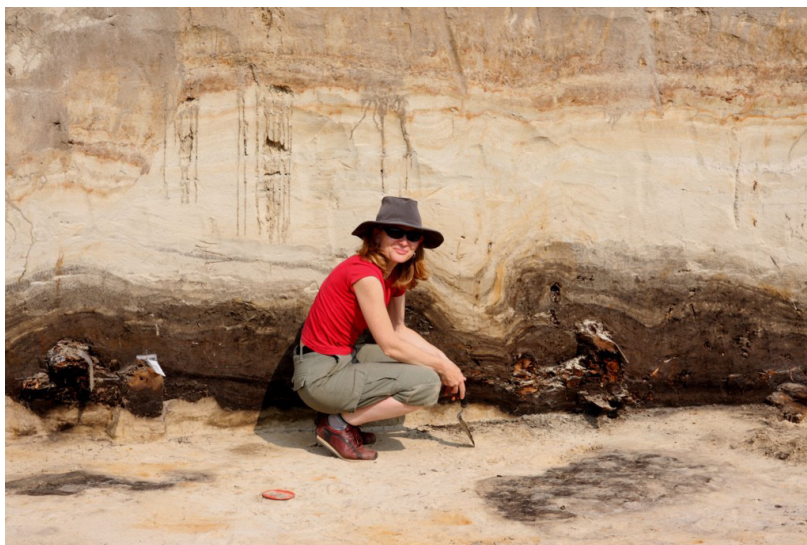
Fot. 3. Struktury niestatecznego warstwowania gęstościowego jako świadectwo środowiska peryglacjalnego

Obszar basenu uniejowskiego podczas zlodowacenia wisły (vistulianu), tzn. ostatniego zimnego piętra stratygraficznego czwartorzędu, około 115 000–10 000 lat BP, znajdował się poza zasięgiem lądolodu, w tak zwanej strefie ekstraglacialnej. Panowanie zimnych, peryglacjalnych warunków klimatycznych wyznaczało kierunek rozwoju rzeźby terenu i determinowało intensywne i wydajne morfogenetycznie procesy. Badania tych procesów stanowiły bardzo ważny kierunek badawczy łódzkich geografów od początku istnienia ośrodka. W skrajnych przypadkach, w czasie apogeum zimna – przy maksymalnym rozwoju lądolodu w okresie vistulianu, co miało miejsce ok. 20 000 lat BP, gdy jego czoło znajdowało się kilkanaście kilometrów na północ od basenu 12 , panowało tutaj środowisko pustyni arktycznej.