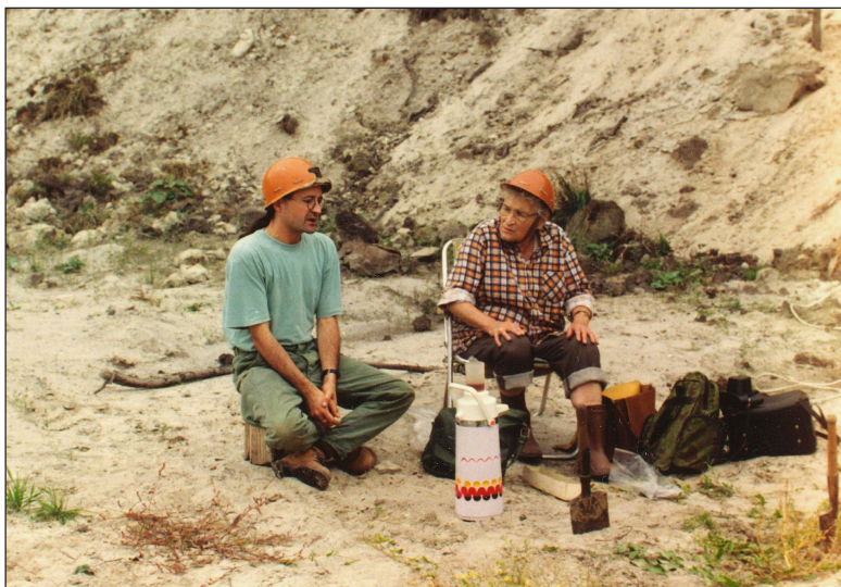
Fot. 1. Badania terenowe osadów lodowcowych w odkrywce KWB Adamów, pole Koźmin, 1995

eksploatacyjnym KWB Adamów „Adamów-Smulsko” (fot. 1). Zlokalizowane ono było na wysoczyźnie morenowej, nieco poza granicami basenu, niemniej jednak, jak należało się spodziewać, i co zostało potwierdzone w trakcie późniejszych badań, osady te wyścielają również analizowany obszar. Rekonstrukcja paleogeograficzna oparta była na wielokierunkowej identyfikacji osadów 5 .