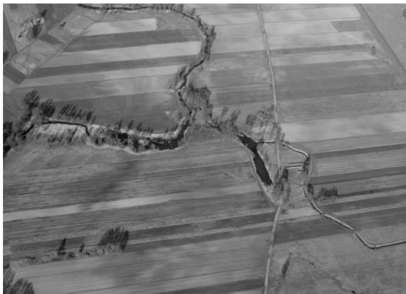
Ryc. 1. Współczesne zdjęcie lotnicze okolic Spycimierza z oznaczeniem relikwów grodziska

Gród pierścieniowy przestał funkcjonować zapewne w początkach XIV stulecia. Zidentyfikowane ślady katastrofy pożarowej mogą sugerować przywołane wcześniej wydarzenie historyczne dotyczące najazdu Krzyżaków w 1331 r., którzy – jak potwierdzają źródła pisane – spalili gród i pobliskie osady. W zachodniej części zniszczonego uprzednio wału grodowego I fazy usypano w 1 połowie XIV w. stożkowany kopiec, stanowiący podstawę pod budowlę obronną typu wieżowego, której pozostałości nie stwierdzono. Wiadomo natomiast, że nasyp grodu II fazy otoczony był drewnianą konstrukcją oraz fosą. Luźne znaleziska archeologiczne pozwalają datować rozwój grodu na późne średniowiecze. Było to zapewne związane z czasowym przejściem osady obronnej przez świecki ród możnowładczy Ogonów, którzy być może planowali stworzyć tu swoją siedzibę 40 . Dzięki pracom poszukiwawczym ujawniono pozostałości faszyny umacnianej kamieniami z drewnianymi obramieniami. Udało się w ten sposób zrekonstruować przebieg dawnej grobli lub drogi prowadzącej od Spycimierza do przeprawy na Warcie w kierunku Uniejowa (ryc. 3). W 2014 r. przeprowadzono kolejną serię nieinwazyjnych badań na tym obszarze w ramach szerszego projektu naukowego poświęconego grodziskom centralnej Polski. Interdyscyplinarne badania realizowane były pod auspicjami Stowarzyszenia Naukowych Archeologów Polskich,