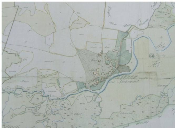
Ryc. 4. Plan Spycimierza z 1804 r.

wy, co doskonale prezentuje załączony plan z 1848 r. (ryc. 5) 52 . Nastąpił rozwój przestrzenny wsi w kierunku zachodnim na obszarach, które do tej pory nie były zagospodarowane ze względu na gorsze warunki środowiskowe, niekorzystne z punktu widzenia działalności rolniczej. Dostrzec można także rozwój zabudowy w kierunku północnym, wzdłuż drogi prowadzącej w rejonie kościoła, równoległe do meandra rzeczno-