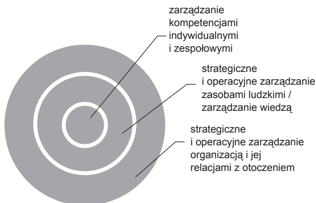
Rys. 1. Wzajemne relacje strategicznego zarządzania organizacją, zarządzania wiedzą i zasobami ludzkimi oraz zarządzania kompetencjami