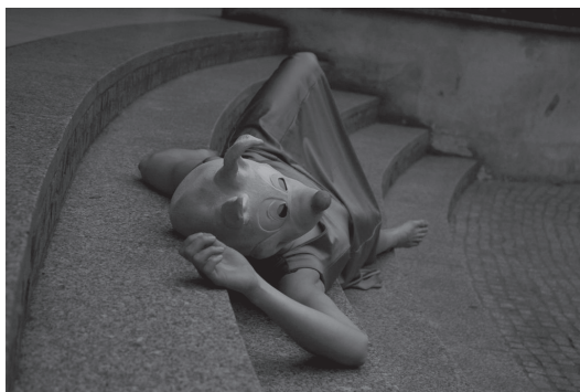
17a i 17b. Finał performance grupy artszenio w patio AHE.

Kolejnego dnia działania grupy artszenio miały miejsce w Łódzkiej Strefie Sztuki, gdzie artyści z Niemiec wraz ze studentkami AHE specjalności tancerz zaprezentowali w Muzeum Książki Artystycznej oraz halach pofabrycznych Strefy Sztuki improwizacje taneczne odnoszące się do miejsca.