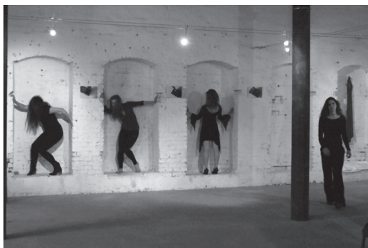
16. Grupa artszenio – performance „sacred-doors” / Galeria Nowa Przestrzeń.