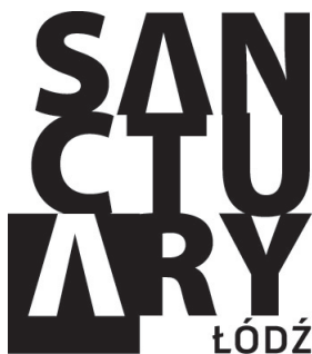
1. Logo projektu artystycznego „Sanctuary” – ilustracja

Być bezpiecznym to podstawowa potrzeba każdego z nas. Czy znasz uczucie, że świat kręci się coraz szybciej? Czy czasem czujesz się przytłoczony mailami, telefonami, postami? Znasz tę potrzebę odpoczynku, zwrócenia się ku bezpiecznemu miejscu? Naszym celem jest poszukiwanie takich właśnie bezpiecznych miejsc, w znaczeniu zarówno realnym, jak i metaforycznym, oraz próba znalezienia odpowiedzi na pytania: gdzie chowamy się przed żądaniami dnia codziennego? Jak odpoczywamy? Czy mamy stałe miejsca, do których się udajemy, czy też kreujemy powtarzające się sytuacje, osobiste rytuały?