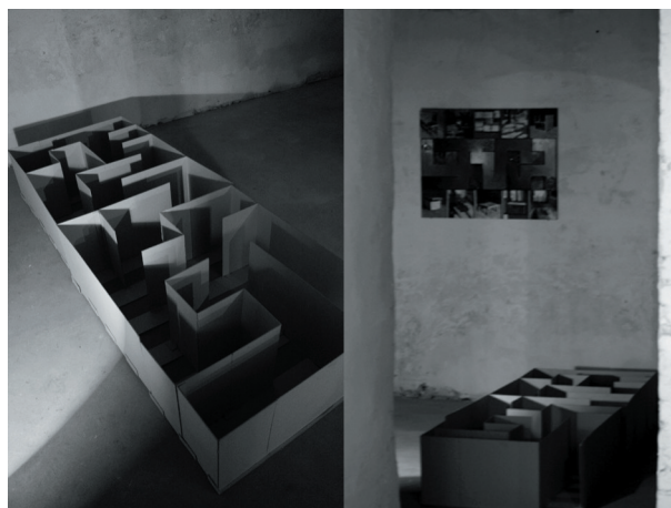
12a i 12b. Tomasz Wajda / Wydział Artystyczny – Uniwersytet Pedagogiczny w Krakowie.

Podczas otwarcia wystawy swoją prezentację miała niemiecka grupa artscenico. Artscenico-performing arts to stowarzyszenia zrzeszające aktorów, tancerzy, choreografów. Prace grupy skoncentrowane są na działaniach konfrontujących sztuki performatywne i umieszczaniu ich w różnych kontekstach.