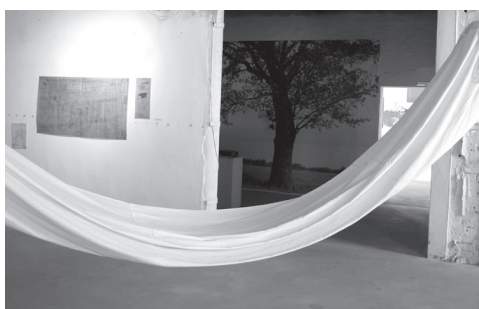
6. Sanctuary – Wystawa / Galeria Nowa Przestrzeń AHEart.