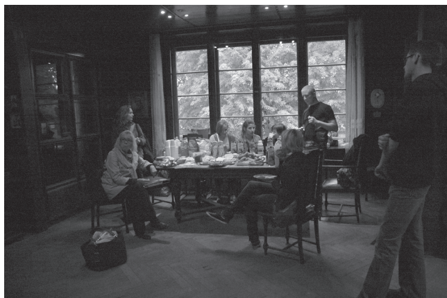
18. Uczestnicy projektu Sanctuary / Muzeum Książki Artystycznej