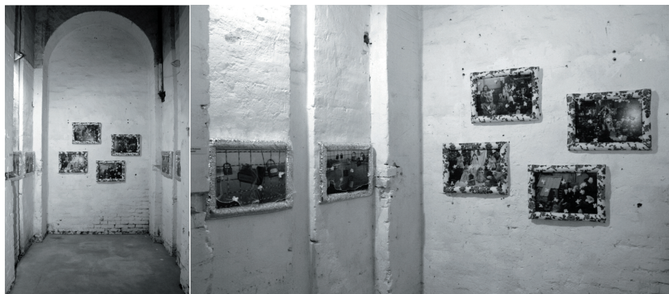
5a. i 5b. Grażyna Brylewska – „pop aktualia”.

Zwróciłam się do różnych twórców, żeby indywidualnie, za pomocą właściwych dla siebie środków wyrazu spróbowali odnieść się do tematu „sanktuarium” i zaproponowałam intermedialną wystawę, czyli wystawę, która urzeczywistnia się za pomocą języka różnych środków wyrazu, przy czym kontekst przestrzeni i dzieła ma w przypadku „Sanktuarium” duże znaczenie.