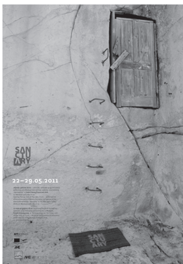
2. Sanctuary poster – ilustracja/podpis.

W dniach 22–29 maja 2011 r. w Łodzi odbyła się polska część projektu, na którą złożyły się: intermedialna wystawa, performance – site specyfik , oraz dyskusja z udziałem uczestników projektu i zaproszonych gości, odnosząca się do idei projektu.