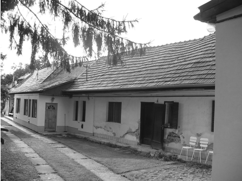
Zabudowania przy Rákóczi utca 14